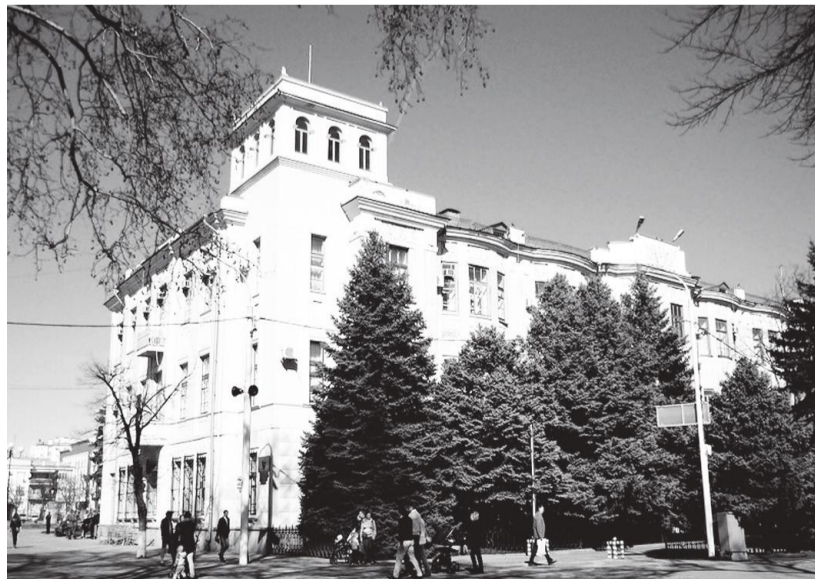
Здание Арбитражного суда Краснодарского края