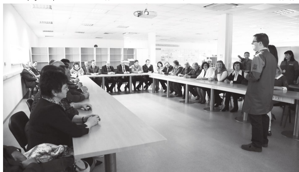
Работники производства рассказали о новых технологиях