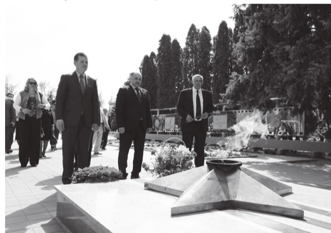
Отдали дань памяти погибшим в ВОВ

В Южном федеральном округе таких крупных вузов, занимающих 174 гектара, больше нет. Учитывая огромный Ботанический сад, два