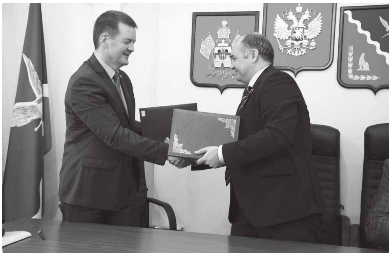
Подписание соглашения о сотрудничестве

Для делегатов провели экскурсию по молочному комбинату, ООО «Кубань Нестле», кондитерскому предприятию «Кубань». Эти производ-