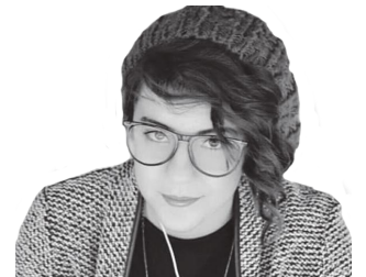
Ходрож Ариж Ливан, город Базурия

Мой отец окончил докторантуру в Москве, сейчас он руководит органами госбезопасности Сирии. Я директор государственного телеканала в Латакии. Для профессионального роста решил получить управленческие знания. О Краснодаре и вашем вузе мне рассказали друзья. Я посмотрел в интернете мнение студентов, большинство рекомендовали Кубанский аграрный университет, так как он большой, красивый, зеленый и много факультетов. Первое впечатление: здорово! Подфак — отличный факультет. Нравится учиться, чувствуется заинтересованность со стороны преподавателей и декана. Строгое и хорошее управление, системность в подаче знаний, процесс обучения организован качественно, очень здорово преподают. Я вижу, что это хорошая возможность для представления Кубанского ГАУ на мировом образовательном рынке. Это ворота, через которые иностранцы знакомятся с Россией, и подготовительное отделение для иностранных граждан выполняет эту роль на «отлично»!