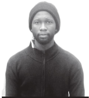
Адамо Луанго, Республика Конго

Я палестинка. Мой отец руководит крупной строительной компанией в Хайфе. Ветеринарным врачом решила стать еще в детстве. В Израиле трудно палестинцу учиться, и мой дядя, который получил образование в Санкт-Петербурге, посоветовал поехать в Россию и подать документы, чтобы попасть на обучение по квоте. Я посмотрела на сайты вузов, и мне понравился ваш университет. Но первое впечатление превзошло мои ожидания, увидев его, воскликнула: «Вау!». Нравятся занятия по химии и биологии. Здесь очень интересная студенческая жизнь: мы посещаем музеи, театры, ходим вместе в парки, на спортивные площадки, у нас на подфаке крутые мероприятия. Я должна ехать продолжать обучение в Екатеринбург, но очень хочу остаться в аграрном. Мой отец сейчас обратился в министерство образования Израиля с просьбой, чтобы для дальнейшего обучения я осталась в нашем университете.