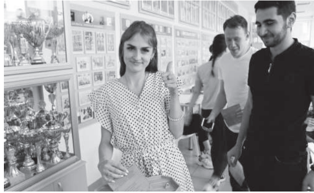
Практиканты во время интеллектуальной игры «За молодежь будущего»

Несмотря на то, что студенты ежедневно проделывали колоссальную работу по тематике своего задания, самыми запоминающимися моментами стали экскурсии на предприятия и культурный отдых. Ребята посетили ООО «ДВВ-Агро», ООО «НовоПласт-Юг», смотрели фильм «Чудо» на улице, побывали на поле казачьей славы, участвовали в мастер-классе по ораторскому искусству, играх «Где логика» и «Карьерный рост».