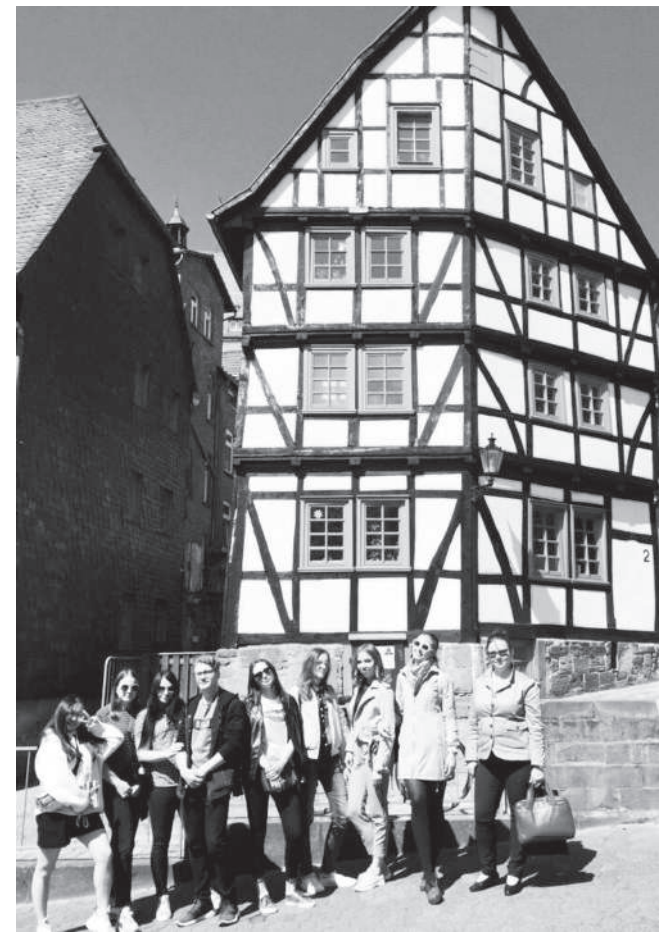
Студенты на экскурсии по городу Марбургу

Все студенты успешно защитили свои работы и получили Свидетельства о прохождении стажировки (на