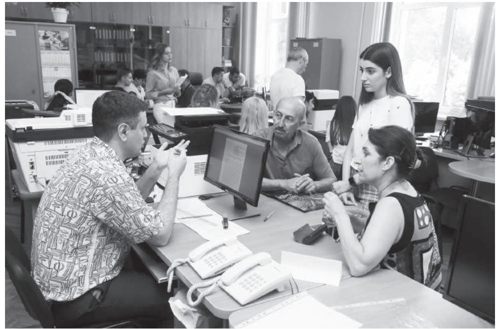
Члены приемной комиссии объясняют условия поступления

– Для зачисления абитуриент подает заявление о согласии на зачисление, к которому при поступлении на бюджетные места прилагает оригинал документа об образовании, при поступлении на места по договорам