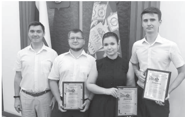
Студенты КубГАУ-призеры премии IQ года