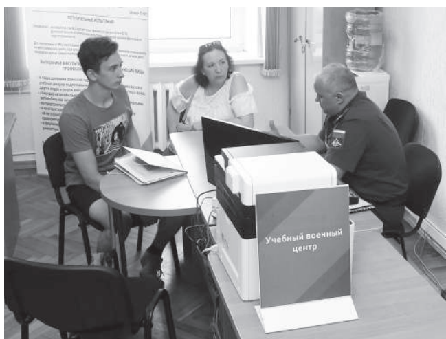
Многие ребята хотят поступить в ВУЗ