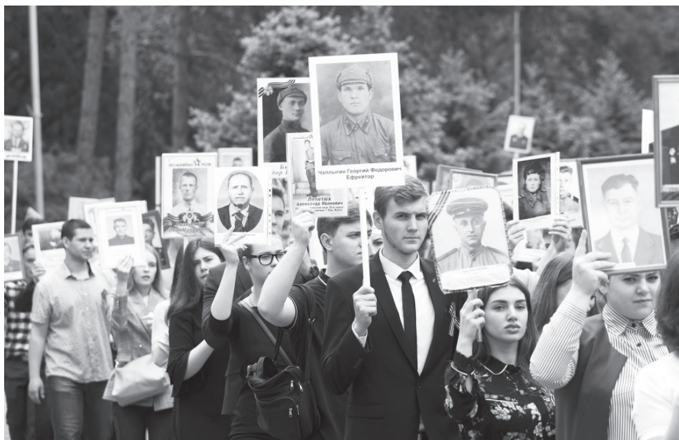
В 2017 г. в «Бессмертном полку» прошли 400 человек, на следующий год – уже почти 1900 человек

Ровно 75 лет назад закончилась Великая Отечественная война. В этот раз мы встречаем праздник в непривычных условиях и, несмотря ни на что, стараемся с душой отмечать самый важный день для нашего народа. Вспомним традиции, которые за много лет сложились в КубГАУ при праздновании Дня Победы, и поделимся воспоминаниями ветеранов.