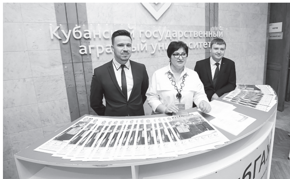
Приемная комиссия КубГАУ будет консультировать абитуриентов дистанционно

– Срок начала приема документов не изменится – «стартовой» датой пока остается 20 июня. А сроки завершения приемов документов, издания