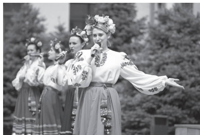
В подарок ветеранам творческая молодежь КубГАУ каждый год готовит праздничные выступления

ного факультета. – И сегодня работа продолжается. Находясь на дистанционном обучении, мы точно так же связываемся с архивами, общаемся с родственниками и продолжаем собирать информацию о наших фронтовиках.