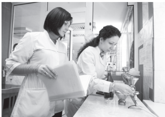
Каждый год лабораторией обрабатывается более 5200 проб компонентов окружающей среды