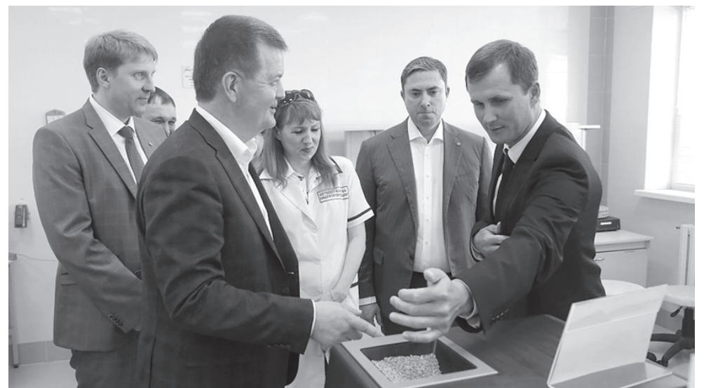
Ректор КубГАУ Александр Трубилин рассказывает о разработках НИИ гостям вуза: замминистра сельского хозяйства России Максиму Увайдову, вице-губернатору Андрею Коробке

Одной из основных проблем современного потребительского рынка является фальсификация продуктов питания.