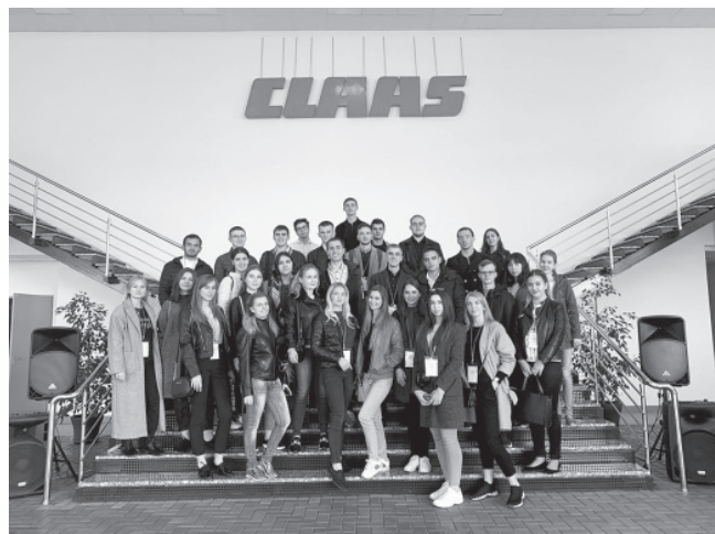
Студенты посетили с экскурсией завод CLAAS и познакомились с работой его подразделений

дали резюме в управление кадровой политики краевой администрации.