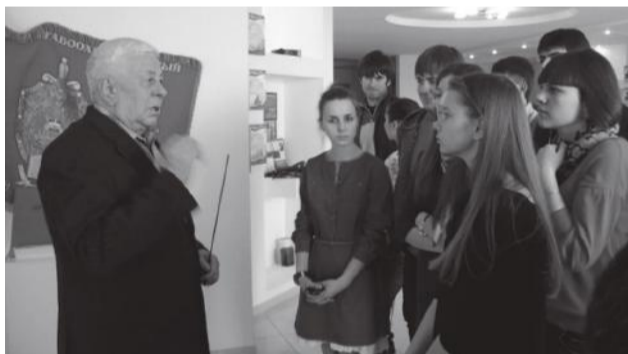
Начальник музея рассказывает студентам о боевом пути части

Студенты также посетили музей летного училища им.