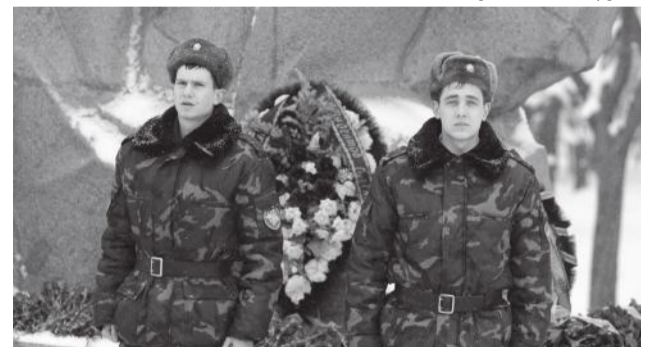
Студенты УВЦ у памятника воинам-освободителям в Чистяковской роще

Студенты инженерно-строительного факультета совместно с профсоюзным комитетом посещают ветеранов в Краснодарском краевом клиническом госпитале для ветеранов войн имени профессора В. К. Красовитова. Регулярно организуются экскурсии в музей воинской славы в парке им. 30-летия Победы, часто проводятся экскурсии в университетском музее, где представлена экспозиция, посвященная участию сотрудников нашего университета в Великой Отечественной войне. Традиционно ко Дню Победы в парке им. 30-летия Победы наш вуз готовит презентационную площадку, на которой мы рассказываем об участии сотру-