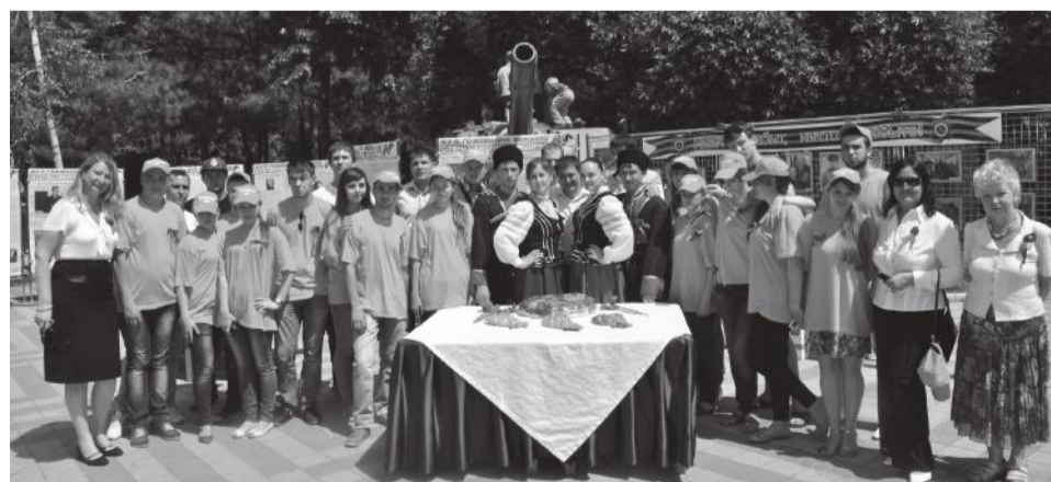
Студенты-волонтеры на презентационной площадке

Заинтересованность и забота, которую наши ребята проявили о гостях, никого не