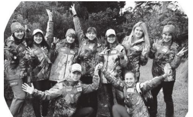
Волонтеры в Адлере

И жизнь закрутилась: ранние подъемы, смены, поздние