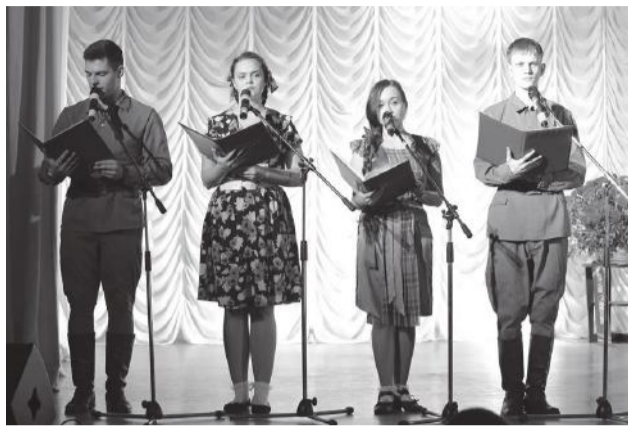
Студенты-участники театрализованного концертного представления

Сценарной группой факультета прикладной информатики были подобраны уникальные кадры из исторических фильмов «Битва за Кубань», «Пашковская переправа», «Малая земля – священная земля», «Ос-