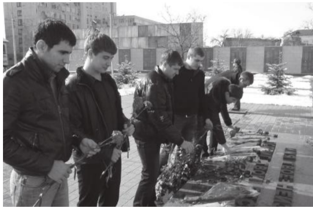
Возложение цветов к Вечному огню

В университете стало доброй традицией ежегодно участвовать в краевом месячнике оборонно-массовой