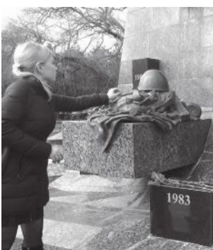
У памятника «Сынам Кубани, павшим в Афганистане»

В Краснодаре в День памяти россиян, исполнивших свой служебный долг за пределами Отечества, прошли мероприятия, посвященные этой дате.