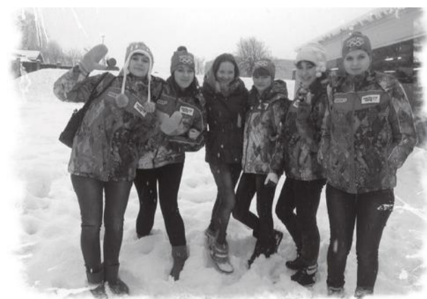
Волонтеры КубГАУ в Красной Поляне

вает четырехкилометровый путепровод, и мы попадаем в зимнюю сказку – горы покрыты снегом, он идет очень крупными и удивительно