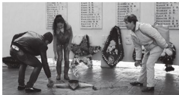
Студенты Анапского филиала с преподавателем на возложении цветов у памятника

Команда Анапского филиала Кубанского ГАУ участвовала в спартакиаде. По мини-футболу заняли 3-е место, по волейболу – 4-е место. Также участвовали в молодежной военно-патриотической акции «Десант славы», где заняли 2-е место. 11 февраля 2014 г. в рамках месячника по военно-патриотическому воспитанию проводились соревнования по многоборью. Команда Анапского филиала Кубанского ГАУ приняла участие в них и заняла 2-е место. Кроме того, были участниками соревнований по пулевой стрельбе из пневматической