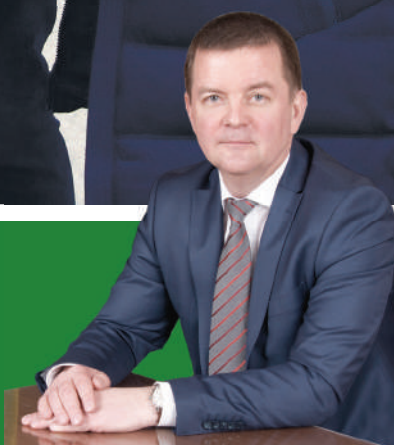
Александр Трубилин, ректор КубГАУ, депутат ЗСК

« Интернационализация всех сфер и структур деятельности вуза, развитие экспорта образовательных услуг, а также расширение форм международной академической мобильности обеспечивают вузу на мировом рынке образовательных услуг конкурентные преимущества »»