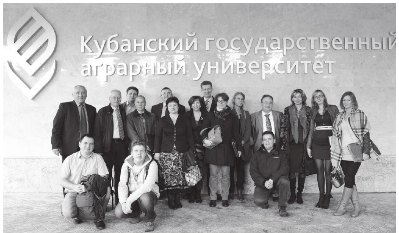
Участники встречи в рамках проекта «Темпус STREAM»

Теплая встреча и радужный прием порадовали иностранных гостей. Участники совещания ознакомились с инновационной базой университета, совершили экс-