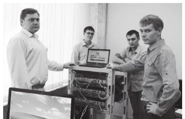
Практическое занятие слушателей Академии Cisco

Программа академий Cisco предоставляет студентам знания в области технологий Интернета, необходимые в условиях глобальной экономики. Сегодня более 11 000 академий действуют в 165 странах. Учебные курсы Академии Cisco разделены на уровни сложности. Для тех, кто желает повысить компьютерную грамотность, предлагается пройти курс IT Essentials. Для специалистов, желающих в дальнейшем найти работу администратора сети или сетевого инженера, разработан курс «Сертифицированный Cisco сетевой специалист: маршрутизация и коммутация» (CCNA R&S). В процессе обучения используется Packet Tracer, программное обеспечение