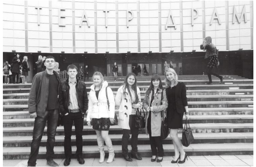
Студенты студии актерского мастерства ФОПа

Студенты из театральной студии ФОПа нашего университета посетили театр драмы, чтобы посмотреть игру профессиональных актеров, поучиться мастерству на спектакле «Ревизор».