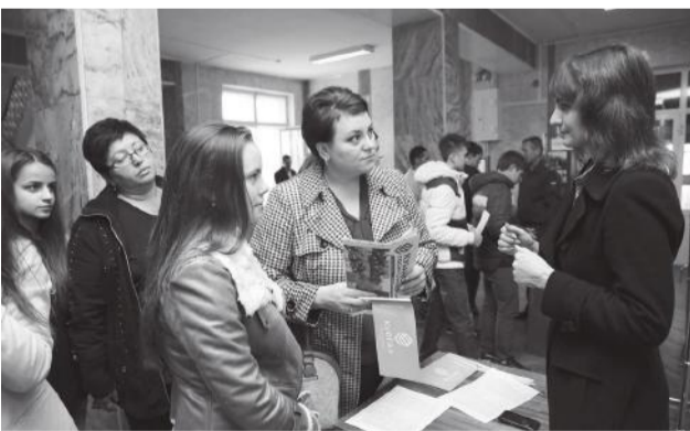
день открытых дверей встреча студентов и преподавателей

Старшеклассники перешагнули порог своей будущей alma-mater. Абитуриенты из Крымского, Ленинградского, Тимашевского, Курганинского, Красноармейского и других районов края, а также из Краснодар штурмовали Кубанский ГАУ, уже давно ставший мечтой многих