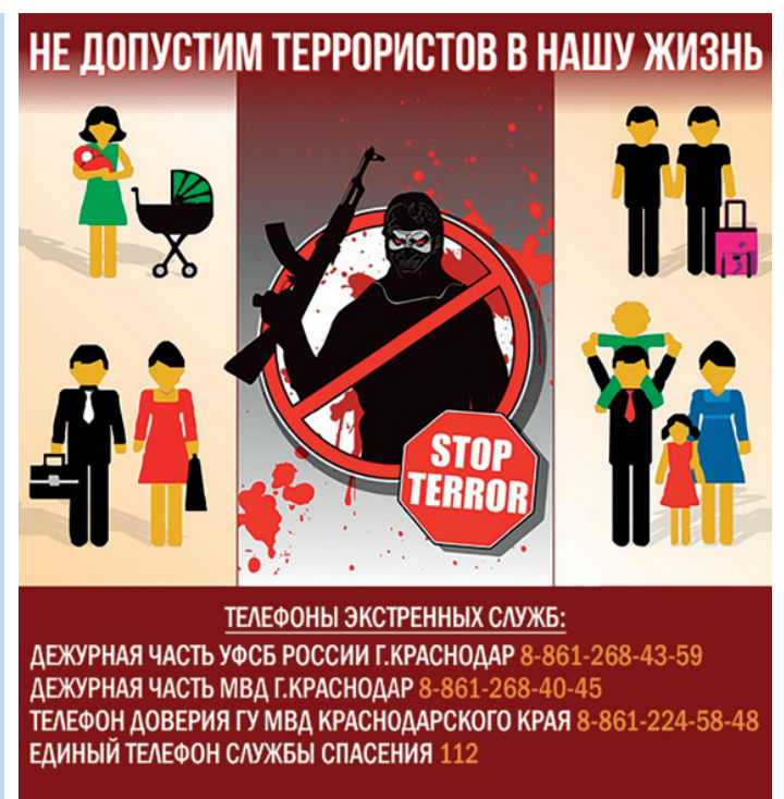
3-е место, группа УП1922