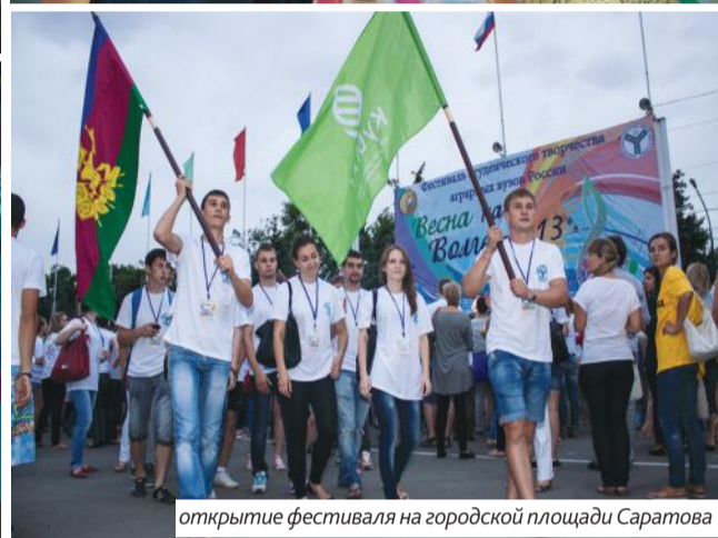
открытие фестиваля на городской площади Саратова