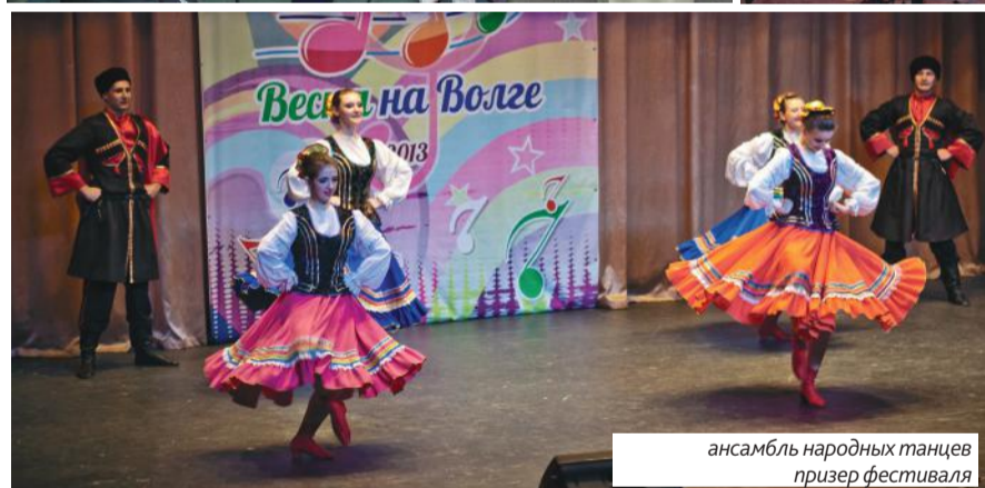
ансамбль народных танцев призер фестиваля