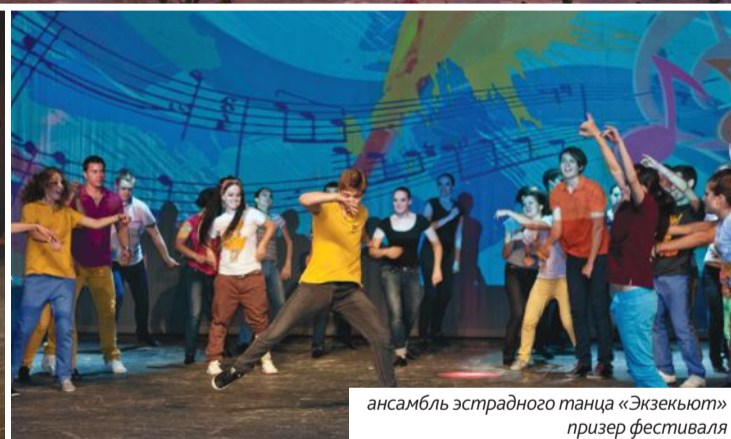
ансамбль эстрадного танца «Экзекьют» призер фестиваля