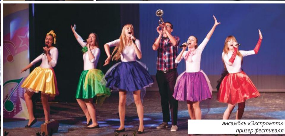
ансамбль «Экспромпт» призер фестиваля