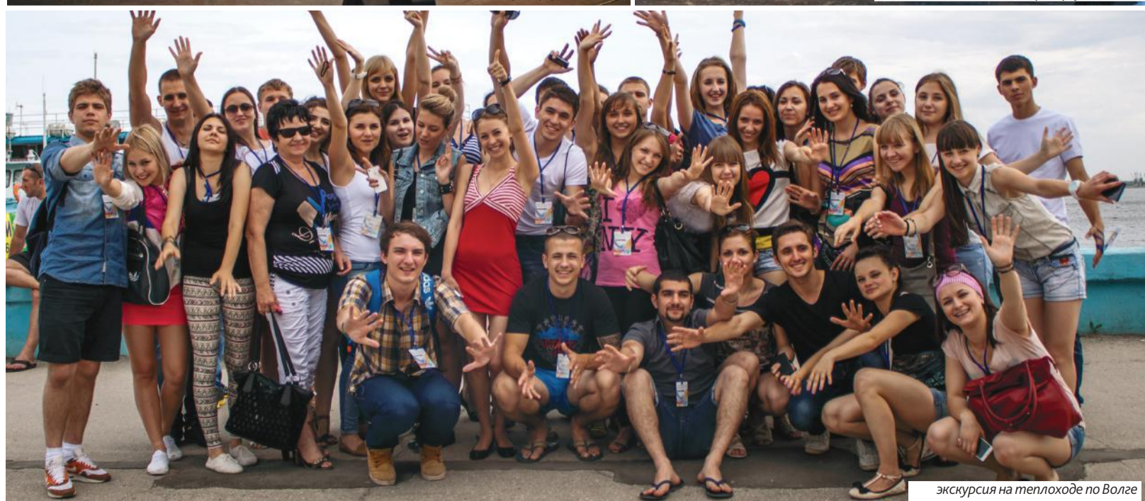
экскурсия на теплоходе по Волге