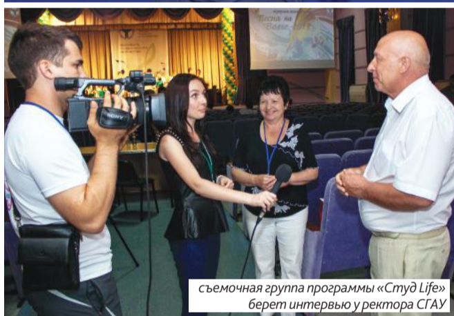
съемочная группа программы «Студ Life» берет интервью у ректора СГАУ