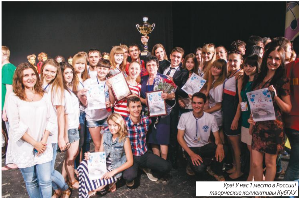
Ура! У нас 1 место в России! творческие коллективы КубГАУ