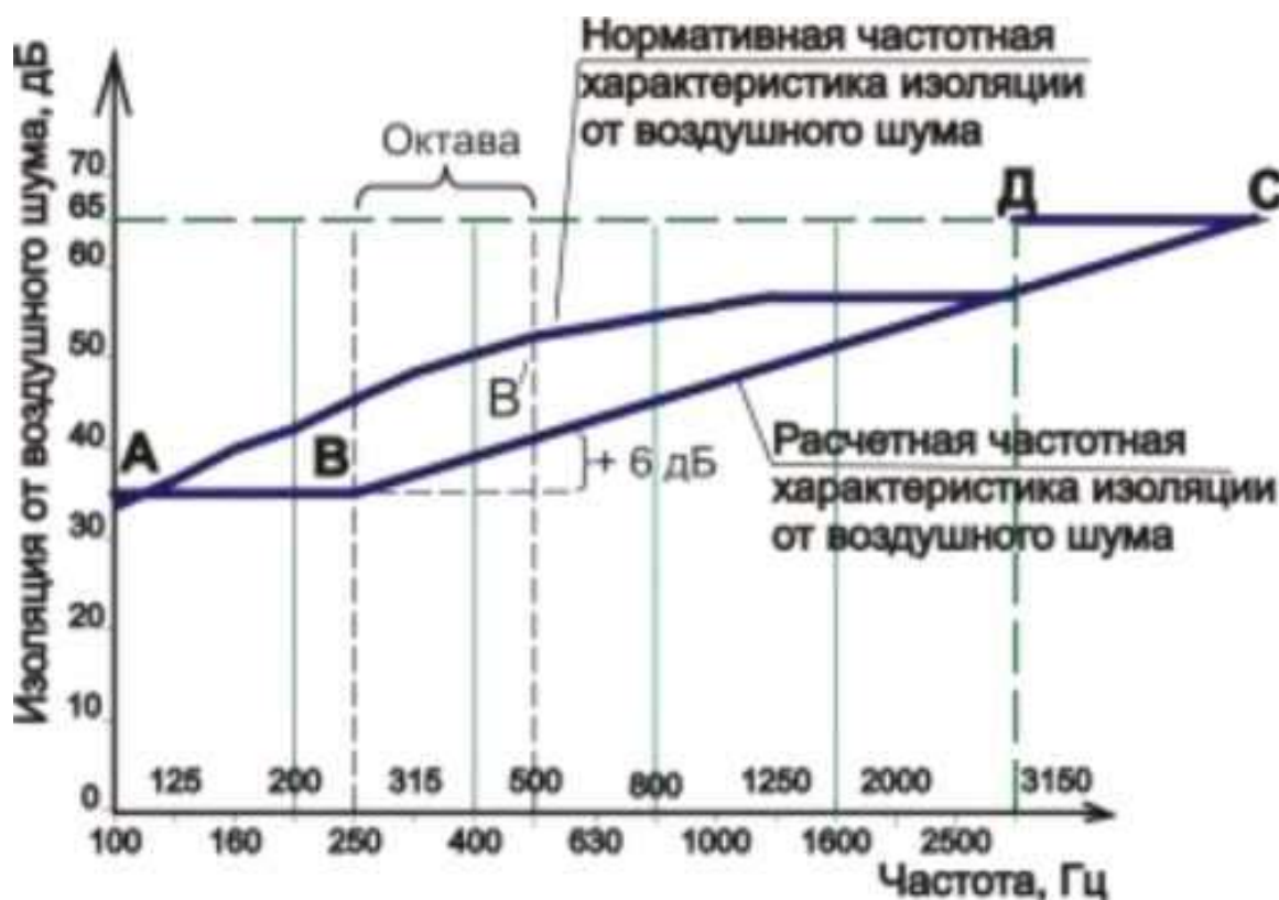
Рисунок 1 - Схема к расчету звукоизоляции перегородки

е) соединить точки ломаной линией. Ломанная АВСД - расчетная частотная характеристика изоляции конструкции от воздушного шума.