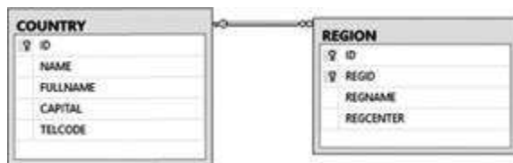
Рисунок 3 – Диаграмма с таблицами базы ExampleBase

Запустите приложение Management Studio, подключитесь к экземпляру SQL Server и восстановите базу ExampleBase из резервной копии. Ознакомьтесь с содержимым таблиц базы данных. Выполните следующие задания.