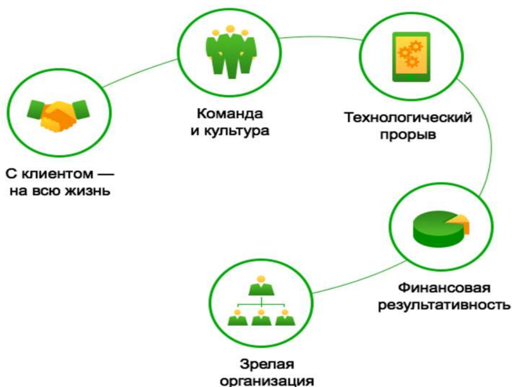
Рисунок 2 - Пять главных направлений развития и стратегических тем ПАО «Сбарбанк России»

Перед вами пять главных направлений развития ПАО «Сбарбанк России» (рисунок 2).