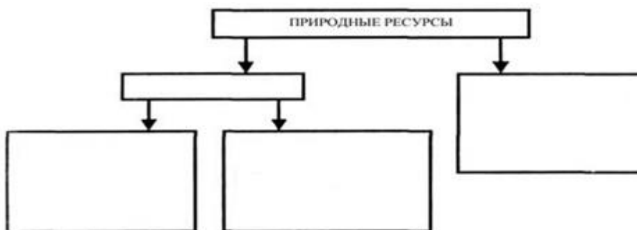
Рисунок 1 – Классификация природных ресурсов

Используя теоретические знания, полученные в лекционном курсе определить виды природных ресурсов. Результат заполнить нарисунке 1.