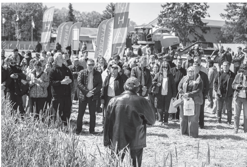
На мероприятии присутствовали ведущие селекционеры, агрономы, животноводы, представители крупных сельхозпредприятий

В учебно-опытном хозяйстве «Краснодарское» Кубанского ГАУ прошёл День кормового поля – научно-практический семинар, организованный совместно с ведущим научным учреждением НЦЗ имени П.П. Лукьяненко.