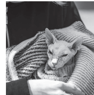
Кого здесь только не было – от обычных кошек и собак до экзотических игуан и аксолотлей

Компания «ВАЛТА» превратила свою зону в настоящий хирургический кабинет: здесь демонстрировали профессиональные инстру-