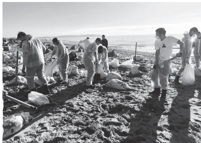
Волонтеры КубГАУ на ликвидации последствий разлива нефтепродуктов в Анапе, 2025 г.

История нашего Волонтерского центра в нашем вузе началась 14 мая 2011 года. Тогда, ровно за 1000 дней до старта зимних Олимпийских игр, КубГАУ стал одним из 26 центров подготовки добровольцев в России. Это было время больших амбиций: студенты нашего университета готовили церемонии открытия, помогали спортсменам и создавали атмосферу праздника, который увидел весь мир. Всего в организации и проведении Олимпийских игр приняли участие 1500 волонтеров Кубанского ГАУ.