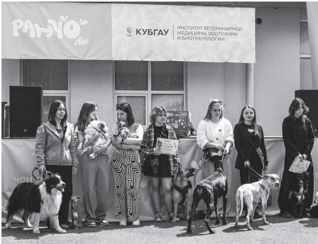
Жюри оценивало не только экстерьер и породу, но и харизму, дружелюбие и связь с хозяином

Где можно подержать на руках паука-птицееда, погладить игуану и сделать фото с питоном на шее? Конечно, в КубГАУ! Недавно в нашем университете прошла II Ежегодная выставка животных «Ранчо-двор», организованная институтом ветеринарной медицины, зоотехнии и биотехнологии.