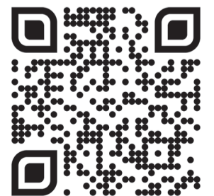
Волонтерский центр КубГАУ

Спортивное волонтерство. Спортивные волонтеры –