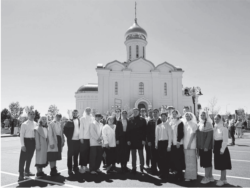
Православная молодёжь Кубанского ГАУ на великом освящении нового храма Рождества Христова в станице Динской

Активисты Кубанского ГАУ могут участвовать в работе и мероприятиях самых разных молодёжных организаций: ездить на целину с Российскими студенческими отрядами, исследовать историю вуза с «Поиском», быть организатором патриотических мероприятий с казачьей сотней. Но также ребята из «аграрного» участвуют и в религиозной жизни нашего края, подробнее – в материале!