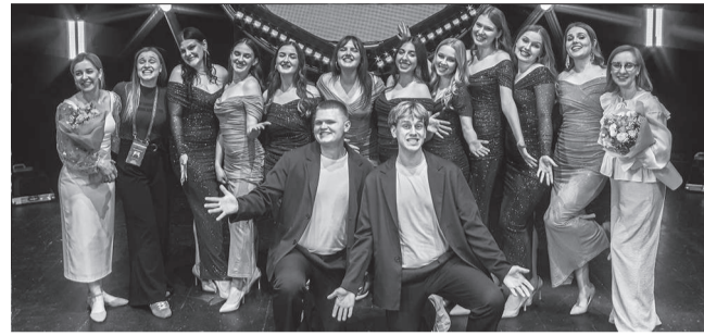
Обладатели Гран-при «Мы вместе» на сцене гала-концерта «Студвесна на Кубани»

– Студвесна дала нам ценный опыт, заставляющий задуматься о развитии и поиске новых точек роста. Несмотря на сложность тем, мы успешно выполнили конкурсные задания и показали нашу исключительную гибкость и способность достигать выдающихся результатов в любых условиях. Новым вызовом для нас стали организация