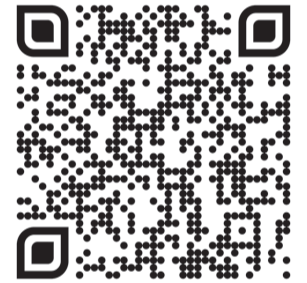
Смотрите сюжет «Первого Аграрного»

Несмотря на то, что выставка «Ранчо-двор» проходит всего лишь во второй раз, она уже успела вырасти из университетского праздника, став важной площадкой для обмена опытом.