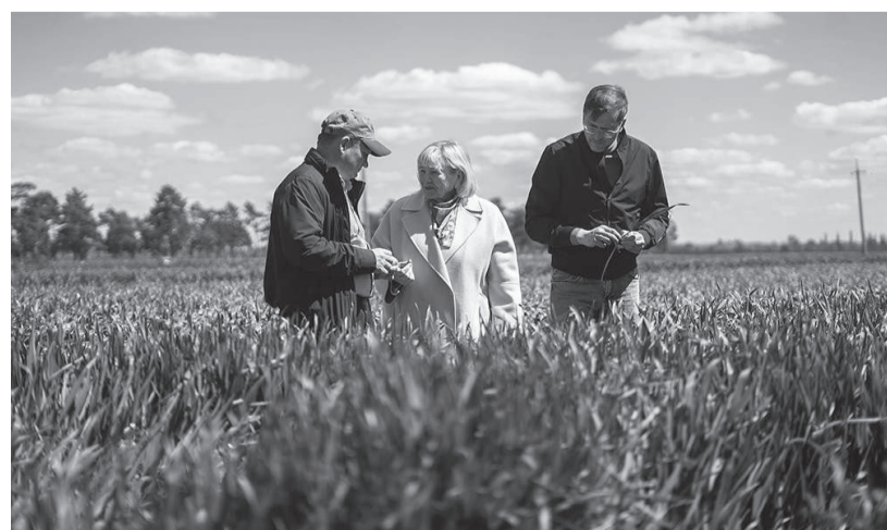
Уже второй год специалисты УОХ «Краснодарское» проводят исследования тритикале совместно с учёными НЦЗ имени П.П. Лукьяненко

Сейчас эксперты завершают обработку данных второго года исследований. Сочетание научной экспертизы селекционеров НЦЗ и производственных мощностей Учхоза «Краснодарское» позволяет рассчитывать, что благодаря таким площадкам животноводческие хозяйства всего Краснодарского края будут включать эту ценную культуру в кормовую базу. А обеспечение отрасли качественными кормами – это прямой вклад в продовольственную безопасность страны.