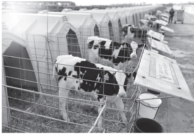
Метод геномной селекции позволяет получить информацию о продуктивности практически с первых месяцев жизни животного

Главная цель исследований – создание технологии, которая позволит ускорить формирование высокопродуктивного поголовья молочного скота. Если раньше на оценку перспективности животных уходило годы, то современные генетические методы позволяют получить