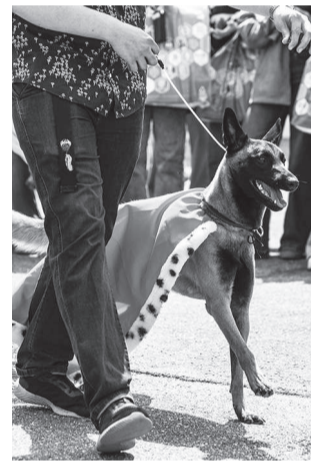
Выбрать победителя конкурса костюмов было очень сложно!

– Первая выставка животных, которую мы провели в прошлом году, задумывалась как факультетское мероприятие. Однако она вызвала столько эмоций и положительных отзывов, что мы решили её масштабировать и сделать ежегодной. В этот раз мы приурочили событие к первому юбилею нашего института: 1 мая нам исполнился ровно год. Надеемся,