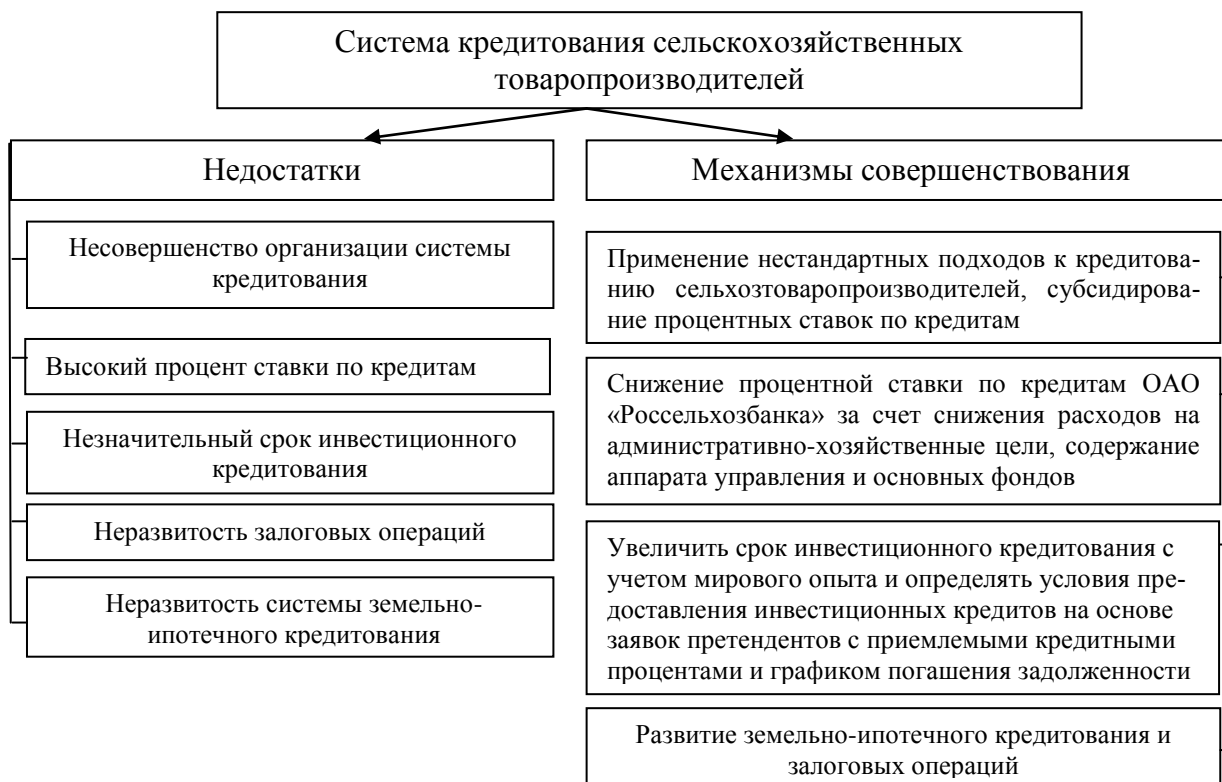
Рис. 3 – Основные причины недостаточной обеспеченности кредитными ресурсами и механизмы совершенствования системы кредитования сельскохозяйственных товаропроизводителей (составлено автором)

В ходе исследований были определены основные причины низкой обеспеченности кредитными ресурсами и механизмы совершенствования системы кредитования сельскохозяйственных товаропроизводителей (рис. 3).