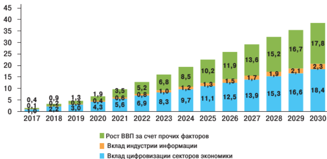
Рис. 1. Вклад в ВВП индустрии информации и цифровизации секторов экономики, % [13]