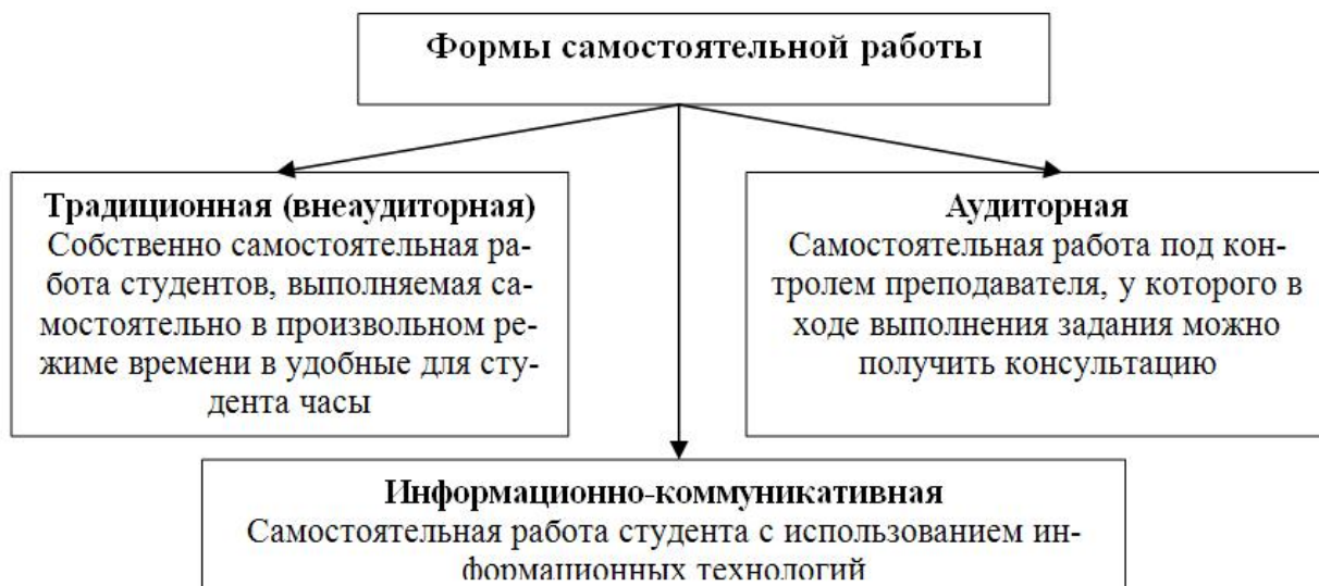
Рисунок 1. Формы самостоятельной работы студентов

Аудиторная самостоятельная работа по дисциплине выполняется на учебных занятиях под непосредственным руководством преподавателя и по его заданиям. Основными формами самостоятельной работы студентов с участием преподавателей являются: текущие консультации; коллоквиум как форма контроля освоения теоретического содержания дисциплин; прием и разбор домашних заданий (в часы практических занятий); выполнение курсовых работ (проектов) в рамках дисциплин (руководство, консультирование и защита курсовых работ (в часы, предусмотренные учебным планом); прохождение и оформление результатов практик (руководство и оценка уровня сформированности профессиональных умений и навыков); выполнение выпускной квалификационной работы (руководство, консультирование и защита выпускных работ) и др.