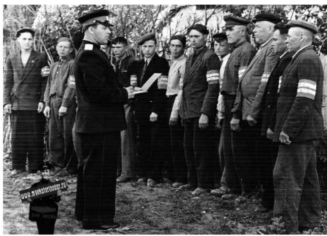
Штаб ДНД, Краснодар, район ВНИИМК, около 1947 г.

В нашем университете народные дружины появились в конце семидесятых. С 1978 года не было ни одного вечера, чтобы студенты и преподаватели не вышли охранять свой студенческий городок от правонарушителей. За