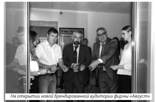
На открытии новой брендированной аудитории фирмы «Август»