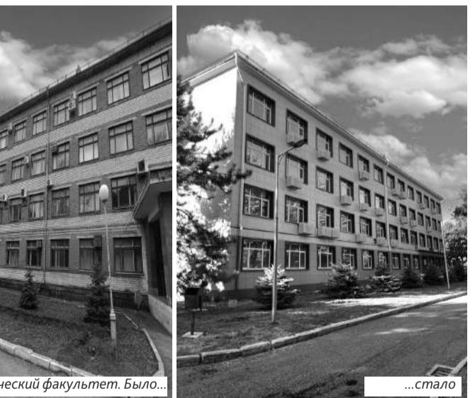
Экономический факультет. Было...