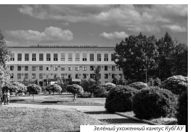
Зелёный ухоженный кампус КубГАУ