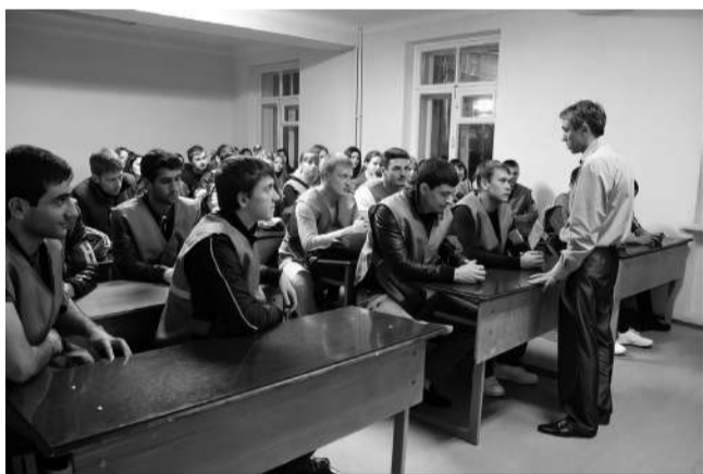
ДНД КубГАУ. Преподаватель проводит инструктаж

Материал подготовлен членами клуба «Поиск»