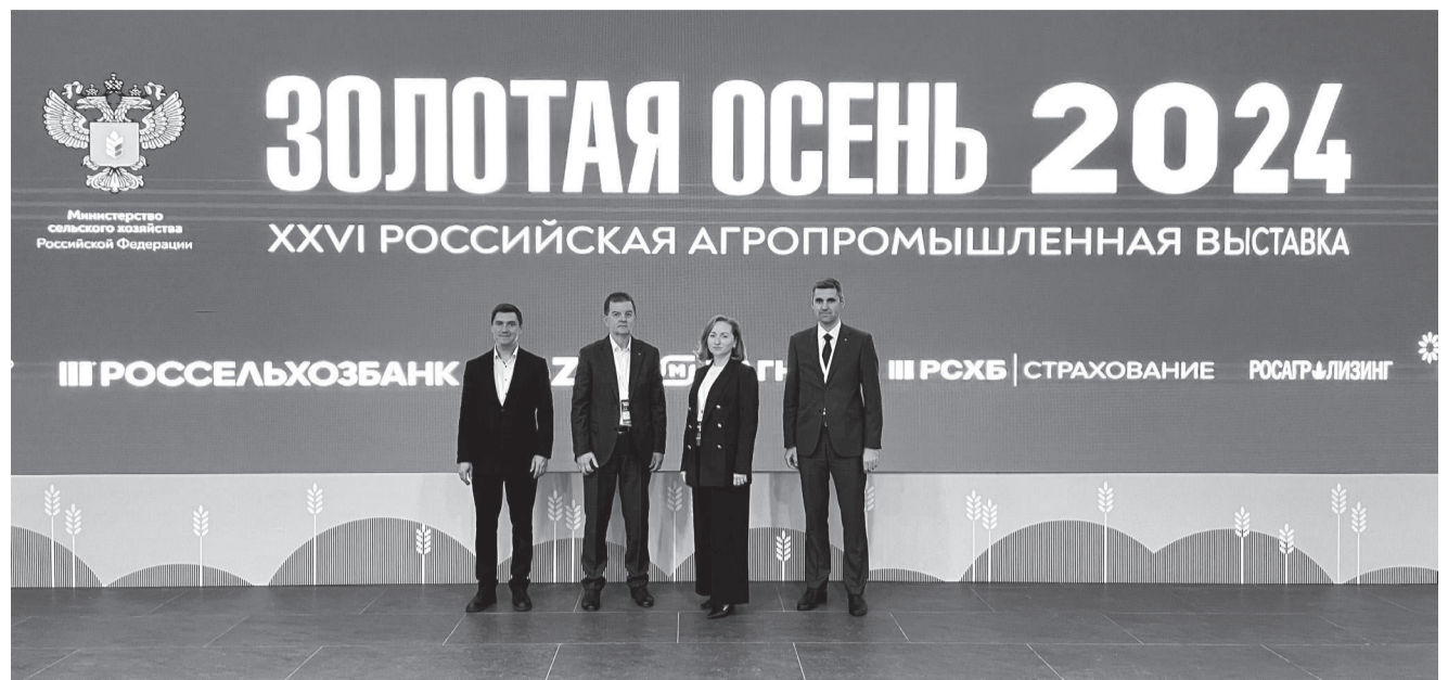
Делегация КубГАУ на агропромышленной выставке «Золотая осень - 2024»

– Мы все понимаем, что бизнес должен быть успешным, а не просто давать цифры по объёмам производства. Он должен зарабатывать для