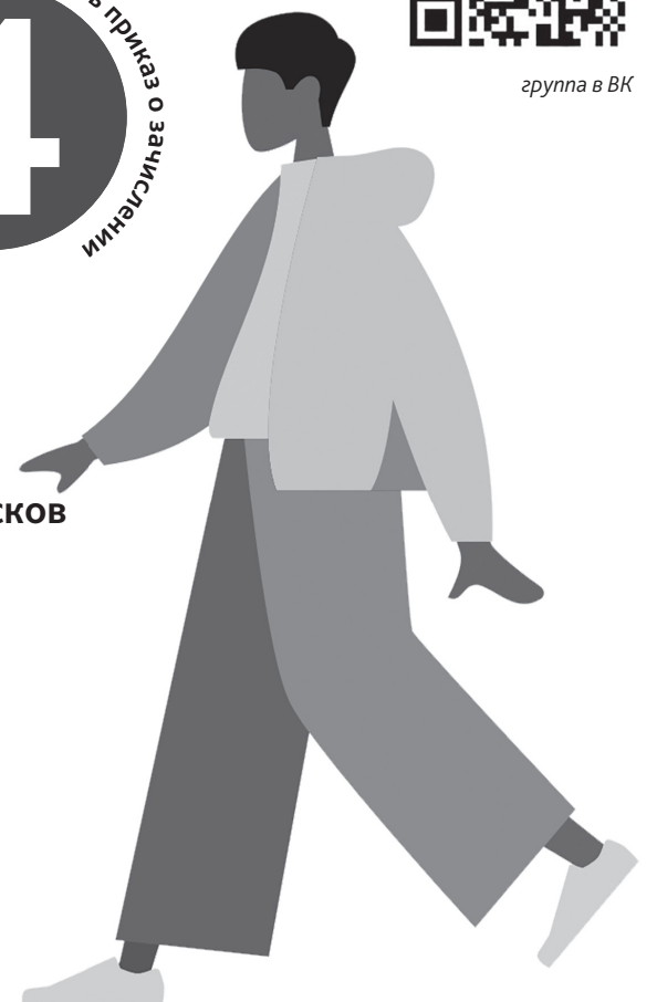
График работы приемной комиссии: – понедельник - пятница: 09:00-16:00 (перерыв: 12:00-13:00); – суббота: 09:00-12:00 – воскресенье выходной

Кол-центр приемной комиссии +7(861)221-58-81 время работы кол-центра: понедельник-суббота: 09:00-17:00