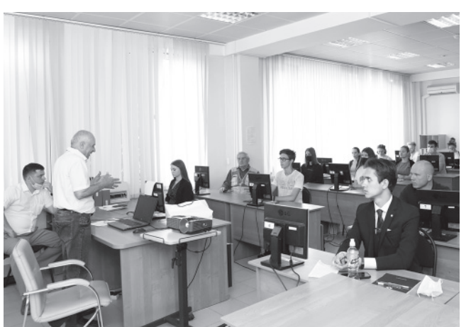
1-е Малтабаровское чтение

Он автор 405 научно-педагогических работ, в том числе 3 учебников по виноградарству (в соавторстве); 22 учебных и методических пособий, 5 монографий (3 из них в соавторстве), 9 рекомендаций, 14 авторских свидетельств и