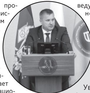
Федор Дерка, министр сельского хозяйства и перерабатывающей промышленности Краснодарского края:

«Основы продовольственной безопасности в условиях цифровизации экономики». Выступления студентов оценивали профессор ведущих экономических и аграрных вузов Рос-