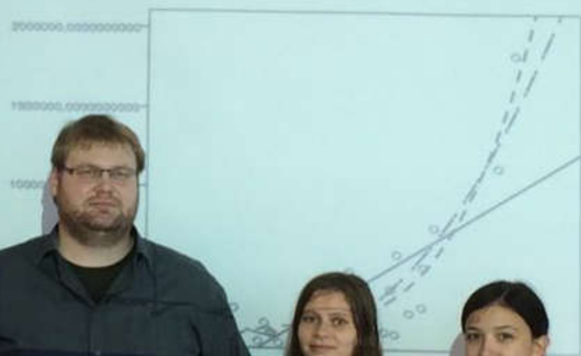
STOCK USD millions

Discussion: DTT = ca movement free of tax ab