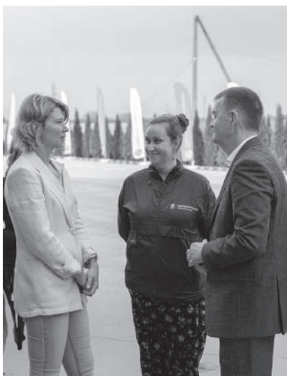
Обсудили передовые научные разработки учёных КУБГАУ, в частности метод геномной селекции КРС

Это очередной повод для гордости успехами наших учёных, аграриев и животноводов! А визит первых лиц государства в учебно-опытное хозяйство ещё раз подчёркивает правильный вектор развития вуза.