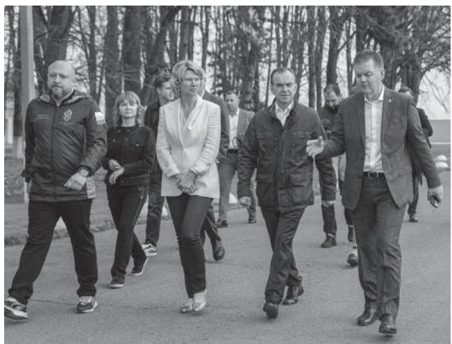
Визит в учхоз «Краснодарское» Кубанского ГАУ

В рамках визита на Кубань Оксана Лут посетила несколько передовых предприятий региона. В их числе – учебно-опытное хозяйство «Краснодарское» Кубанского ГАУ.