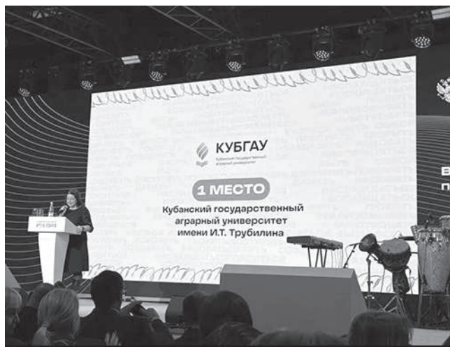
КУБГАУ – лидер по воспитательной работе в РФ

По результатам рейтинга Кубанский ГАУ занял первое место, став безусловным лидером среди российских вузов по направлению воспитательной работы!