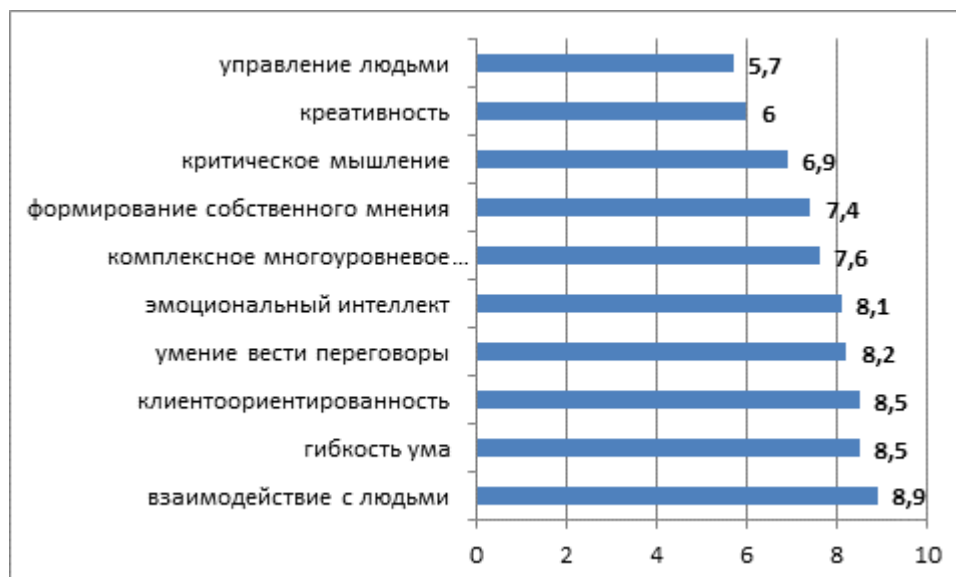
Рисунок – Наиболее востребованные работодателями навыки soft skills, данные за 2020 год (по данным сайта hh.ru)

В целях выявления понимания и освоения «мягких» (общекультурных) компетенций сформулируйте ответы на вопросы: