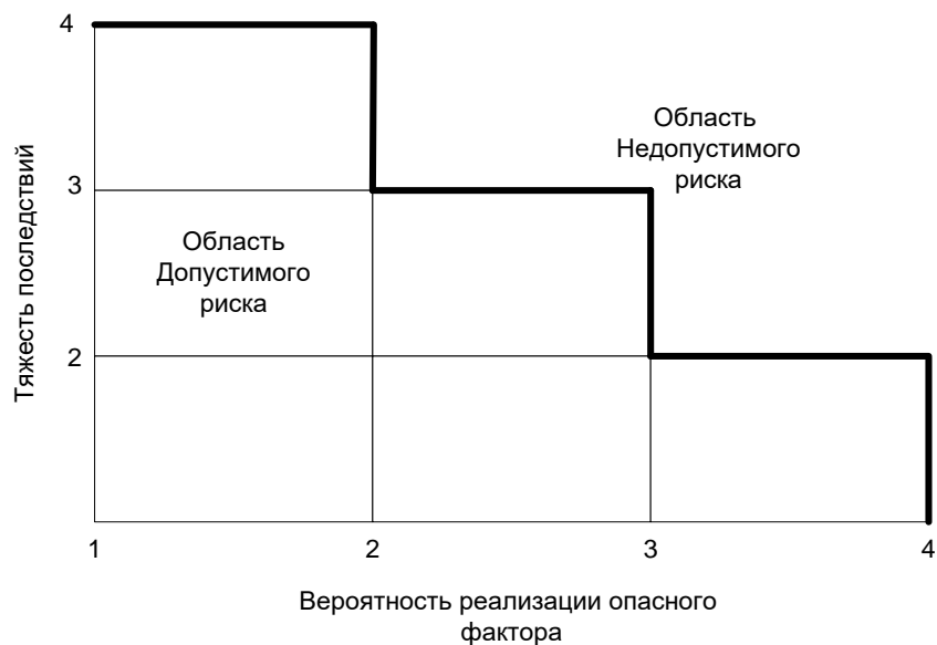
Рисунок 3 – Диаграмма анализа рисков