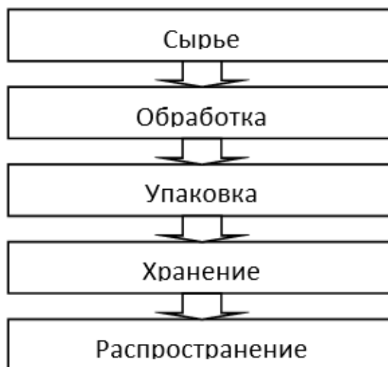
Рисунок 1 – Образец блок-схемы