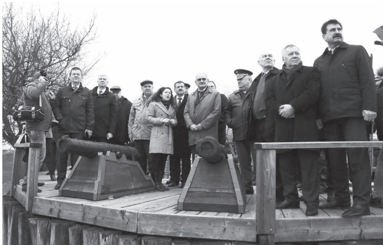
У рек Лаба и Кубань ректорат посетил Александровскую крепость