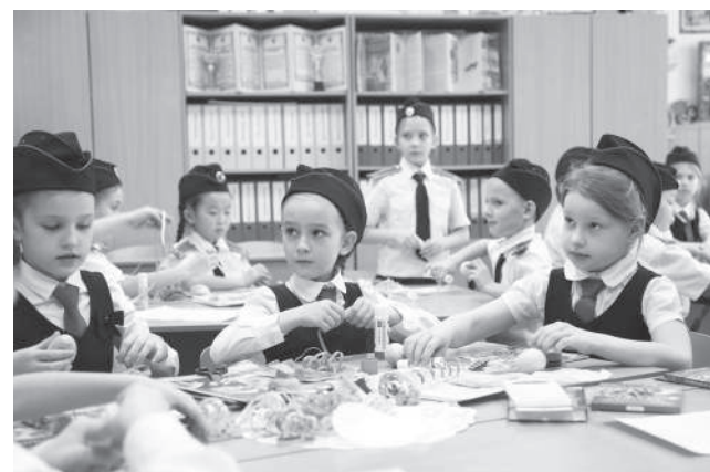
Делегация заглянула и в младшие классы средней школы

АгроХолдинг «Кубань» входит в топ-20 крупнейших аграрных компаний России и