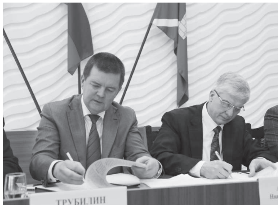
Подписано соглашение между КубГАУ и Усть-Лабинским районом