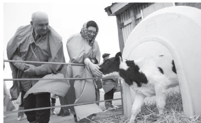
80% сотрудников АгроХолдинга - выпускники КубГАУ