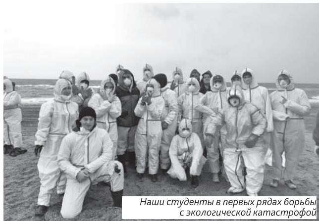
Наши студенты в первых рядах борьбы с экологической катастрофой