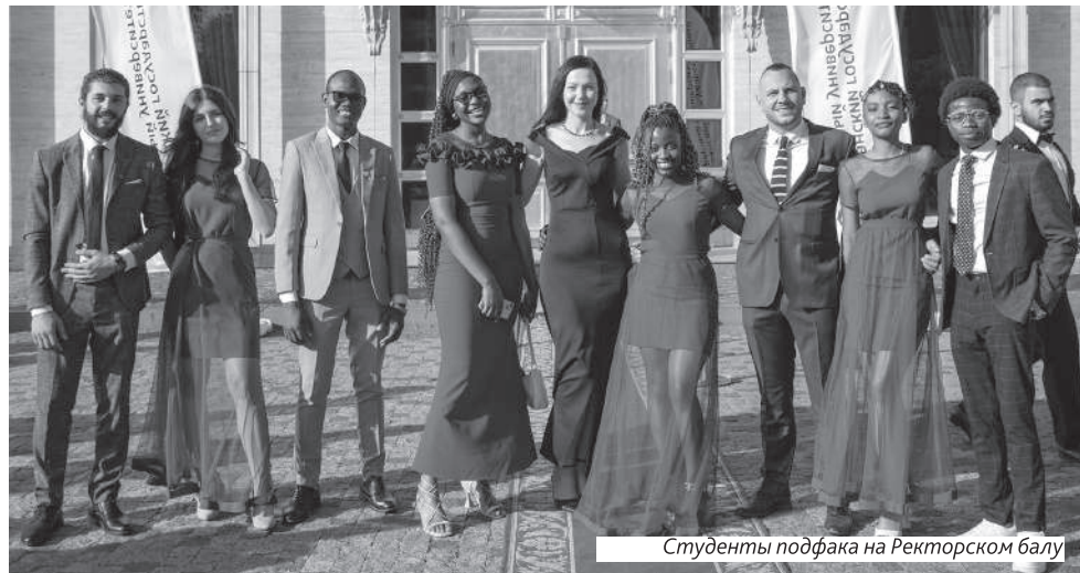
Студенты подфака на Ректорском балу

Преподаватели на подфаке являются одновременно и кураторами групп. Они не только обеспечивают инте-