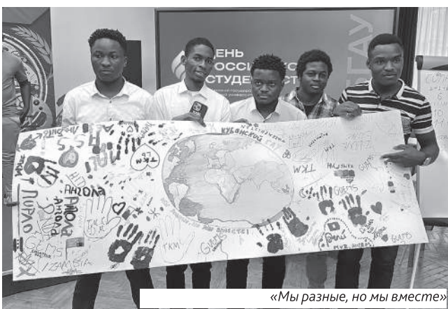
«Мы разные, но мы вместе»