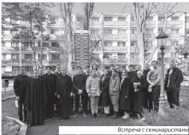
Встреча с семинаристами