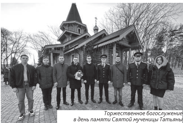
Торжественное богослужение в день памяти Святой мученицы Татианы