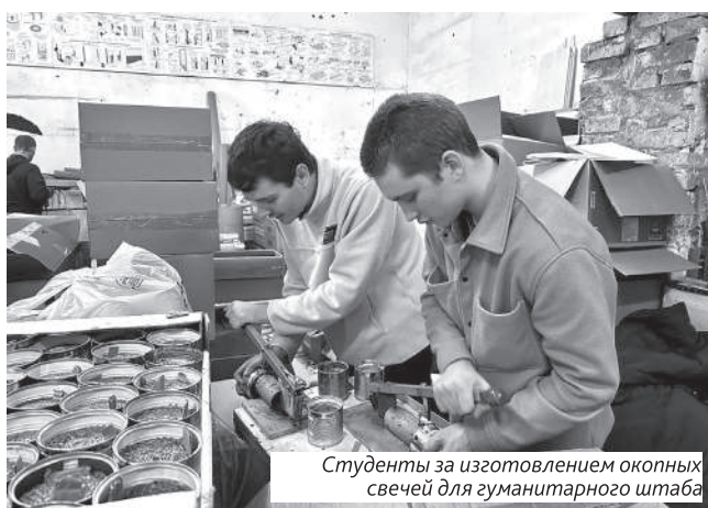
Студенты за изготовлением окопных свечей для гуманитарного штаба