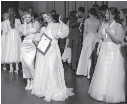
На Ректорском балу

Совсем скоро настанет новый год, который станет ещё более ярким, чем нынешний! Штаб СО Кубанского ГАУ хочет пожелать всем удачи в новом 2025 году. Пусть все ваши самые заветные мечты сбудутся, а грандиозные планы воплотятся в реальность!