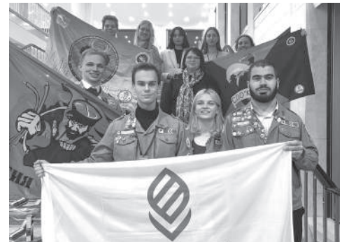
Делегация СО КубГАУ в Кремлёвском дворце