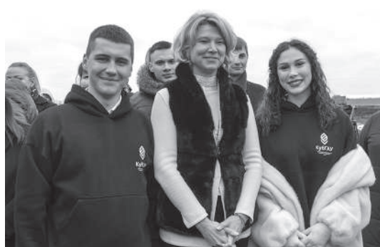
Участники шоу «Практиканты» с Министром сельского хозяйства РФ Оксаной Лут