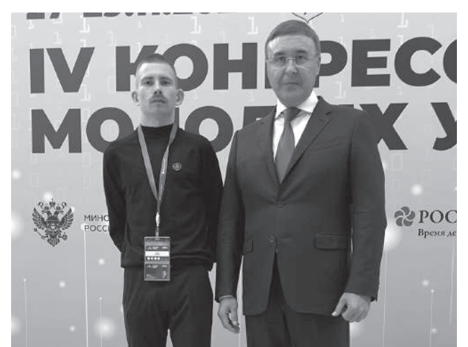
С Министром высшего образования и науки РФ Валерием Фальковым

Участие в Конгрессе молодых учёных стало важным