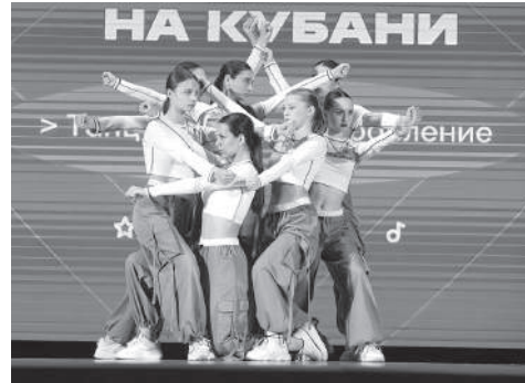
Выступление на краевой «Студвесне»