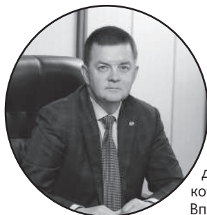
Александр Трубилин, ректор Кубанского ГАУ, академик РАН

Дорогие студенты, преподаватели, сотрудники!