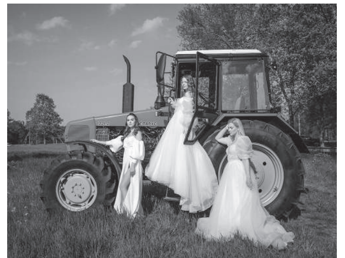
Фотопроjekt «Невесты КубГАУ»