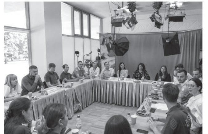
Встреча в Медиациентре в День семьи, любви и верности