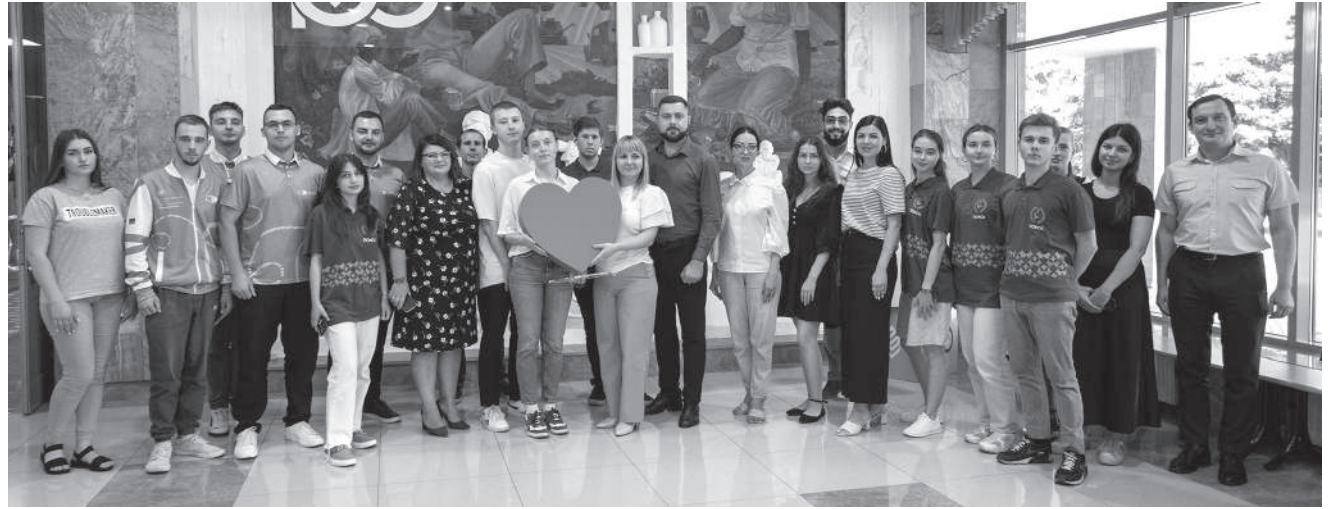
День семьи, любви и верности

– Вступление в брак, семейные отношения (при правильном к ним подходе) дают молодым людям многие преимущества: улучшение психического и физического здоровья, укрепление отношений, повышение уровня удовлетворённости жизнью в целом. Создавая собственную семью, человек приобретает позитивную и поддерживающую среду, которая позволяет ему преодолевать жизненные проблемы и трудности. Любовь и забота, которую человек получает в браке, могут невероятно воодушевить и быть мощным стимулом для осуществления всех жизненных планов. Ведь в нашей стремительной жизни очень легко утратить себя. Гармоничный брак не только способствует развитию индивидуальности каждого из партнёров, но и создаёт прочный фундамент для совмест-