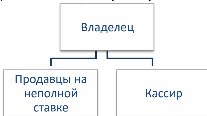
Структура простой организации

Необходимость нанимать работников возникает по самым разным причинам. В случае магазина, структура которого показана на рисунке, какие причины могли быть для найма двух продавцов на неполную ставку и кассира? Назовите три возможные причины, а затем постарайтесь обосновать, почему их не нужно нанимать.