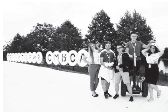
ОСО на федеральном форуме "Территория смыслов 2018"