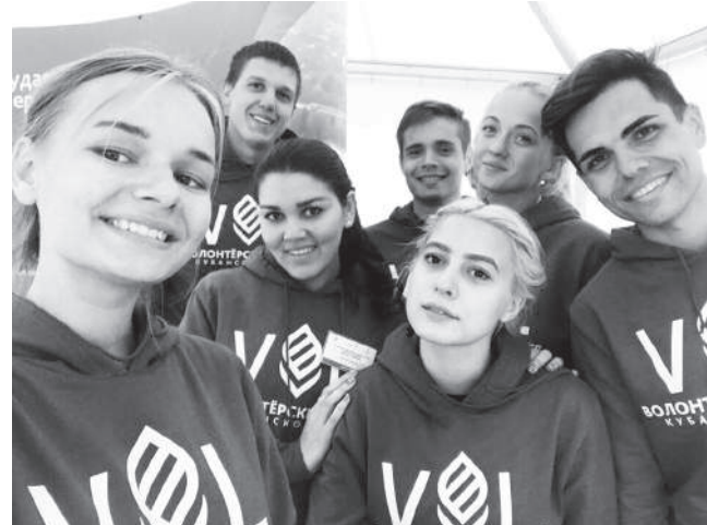
Волонтеры КубГАУ на отраслевом чемпионате профессионального мастерства Agro Skills