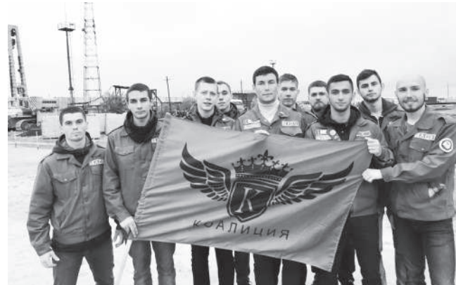
Стройотряд КубГАУ "Коалиция" на Всероссийской студенческой стройке Заполярье