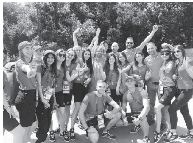
Волонтеры КубГАУ на чемпионате мира по футболу 2018

Если ты хочешь учиться новому и идти вперед, то тебе необходимо зайти на факультет общественных профессий в корпус зооинженерного факультета, кабинет 254, или звони по номеру: 8(861)221-58-69 .