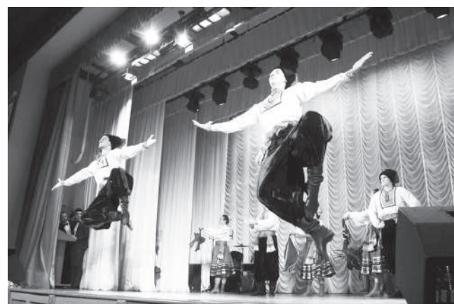
Фестиваль искусств КубГАУ