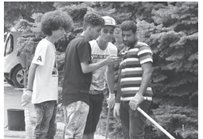
Моя жизнь в России

Автор: Аль-Гараб Абдулразак Абдулхафидх Мохамед Хасан