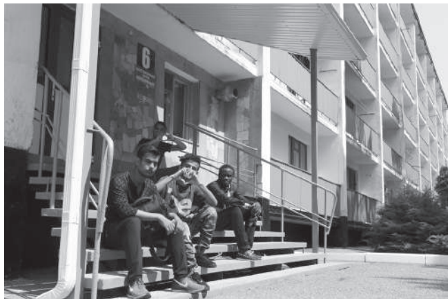
Первый день практики

Говорят, что это довольно сложная работа, особенно из-за погоды, потому что лето очень жаркое, и это затрудняет работу. Случается дождь, который может привести к падению листьев. Мы желаем им хорошей работы и удачи".