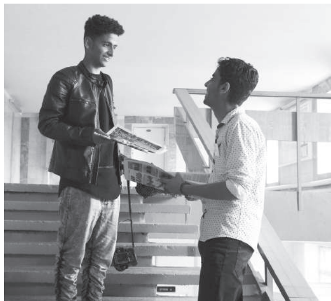
Жизнь в общежитии

Студенческий городок состоит из общежитий. Там живут студенты, которые приехали из других городов и стран.