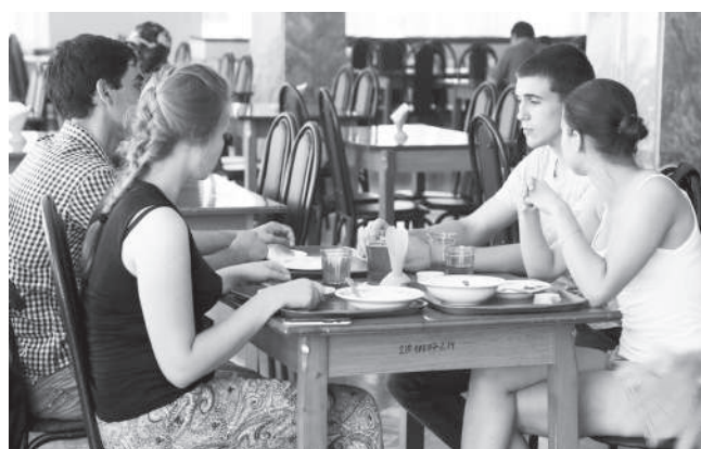
Студенты агрономического факультета