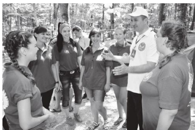
На встрече с молодежью