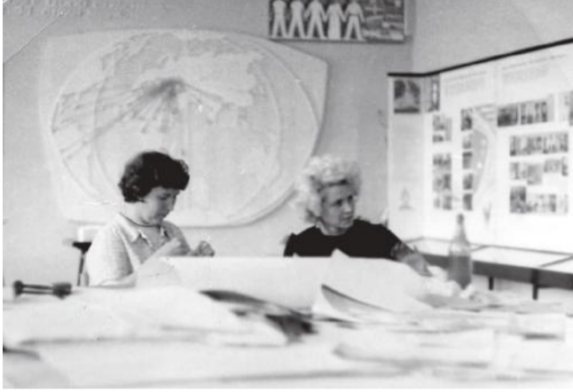
Работа над экспозицией музея, 1970 год

шей молодежи, центром военно-патриотической работы, здесь проходили встречи с ветеранами Великой Отечественной войны, школьники принимали в пионеры и комсомол, ветераны повязывали красные галстуки и давали напутствие