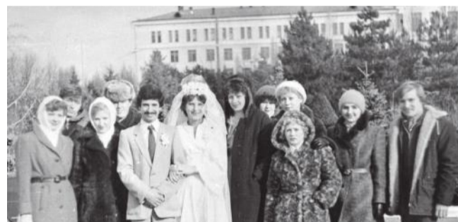
Интернациональная студенческая свадьба, декабрь 1982 года

Языковой барьер преодолели быстро, потому что появилось много друзей. Проголкали по ботаническому саду, дискотеки, общие мероприятия