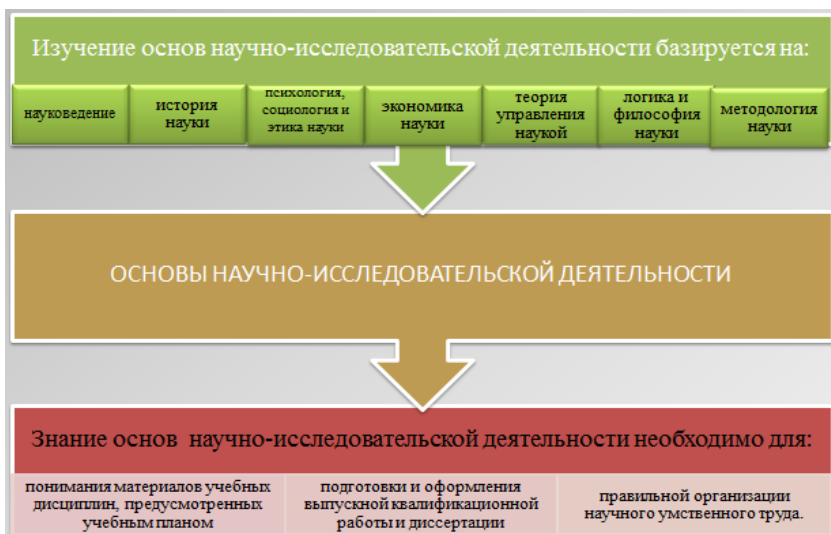
Рисунок 2 – Связь курса с другими дисциплинами