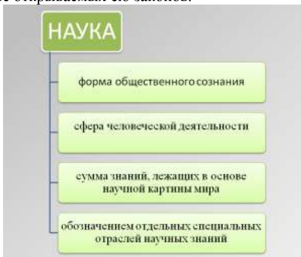
Рисунок 1 – Интерпретации термина «наука»

Непосредственные цели науки – описание, объяснение и предсказание процессов и явлений действительности на основе открываемых ею законов.