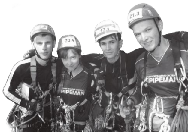
Наши туристы - мои друзья

Когда сидишь у костра, слушая песни под гитару, мысли сами собой приходят в порядок. Песни группы