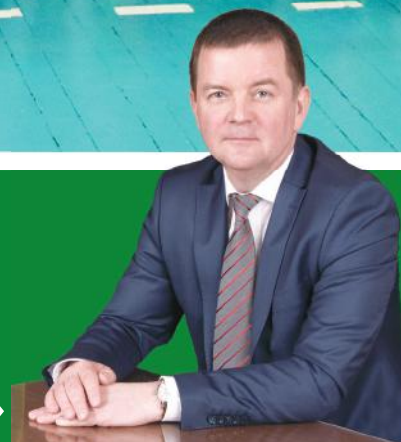
Александр Трубилин, ректор КубГАУ, профессор, депутат ЗСК

« VI летняя универсиада вузов Минсельхоза России и Федерального агентства по рыболовству в Кубанском ГАУ – это праздник спорта, молодости и мастерства. Она станет еще одним шагом вперед на пути к профессиональному росту спортсменов и развитию студенческого спорта в Российской Федерации