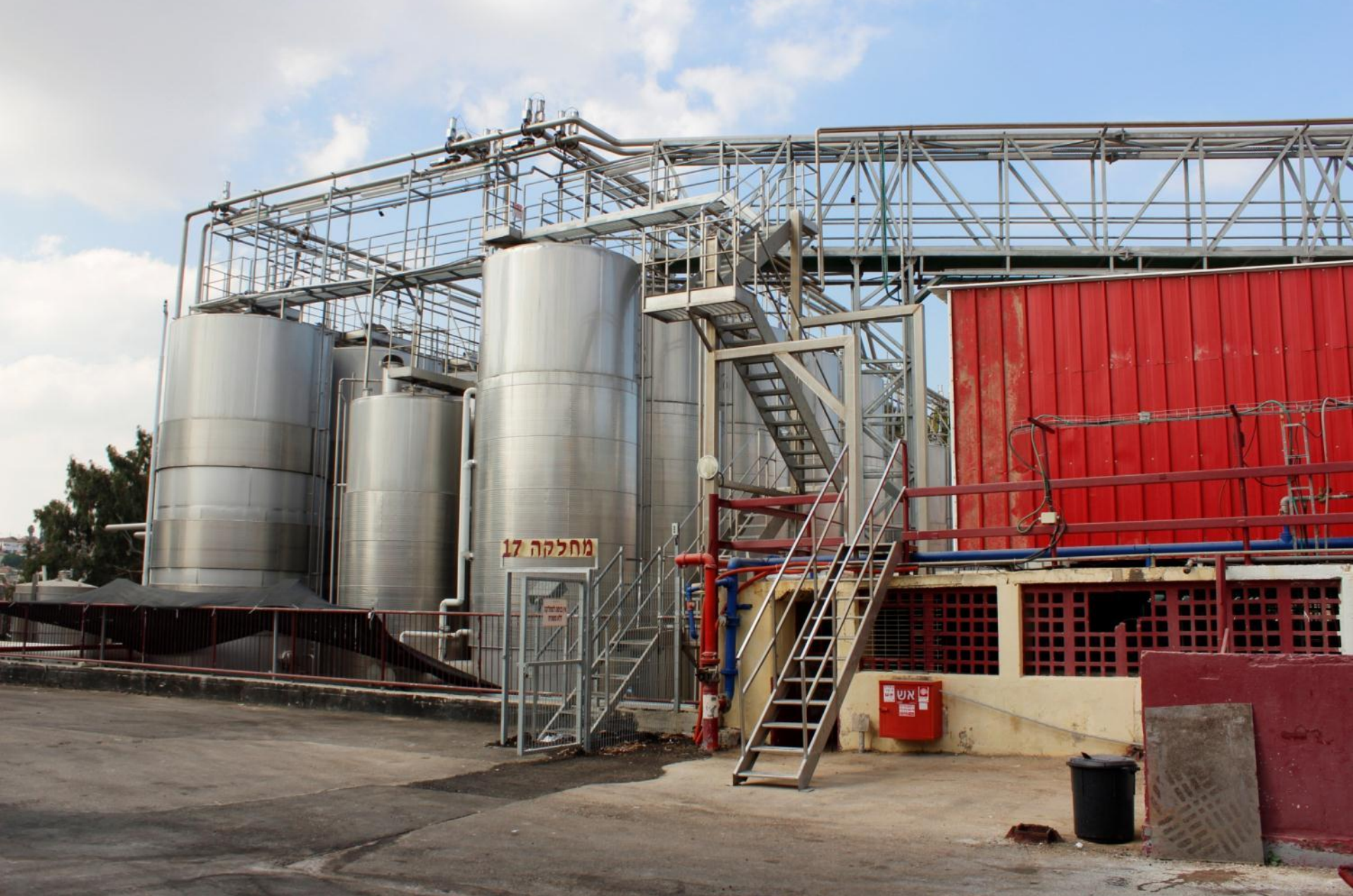
Емкости с охлаждением для сбраживания мезги