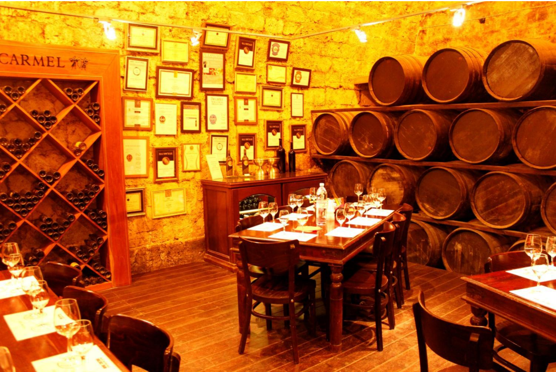
Дегустационный зал в подвале