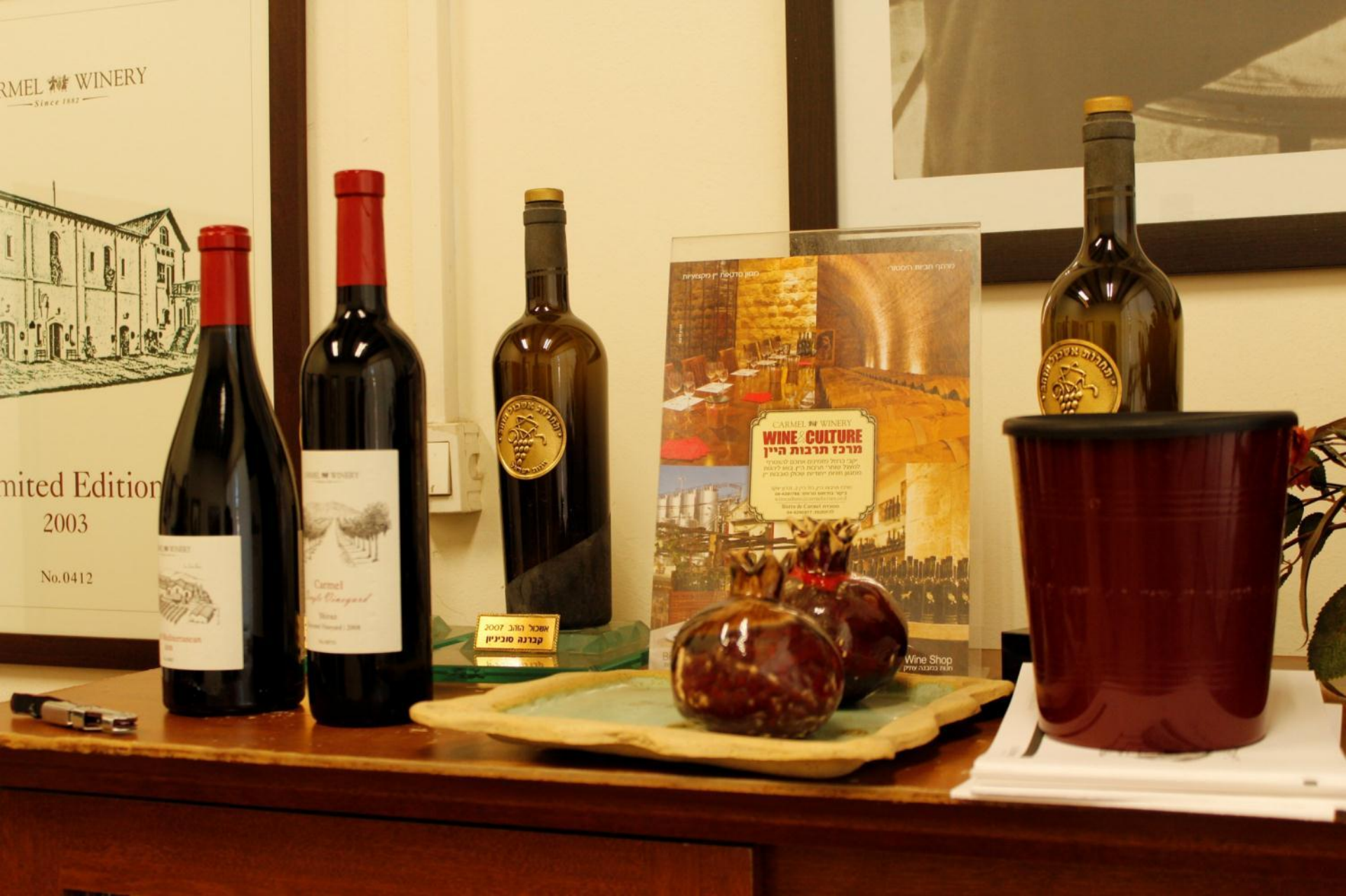
Образцы для дегустации вин