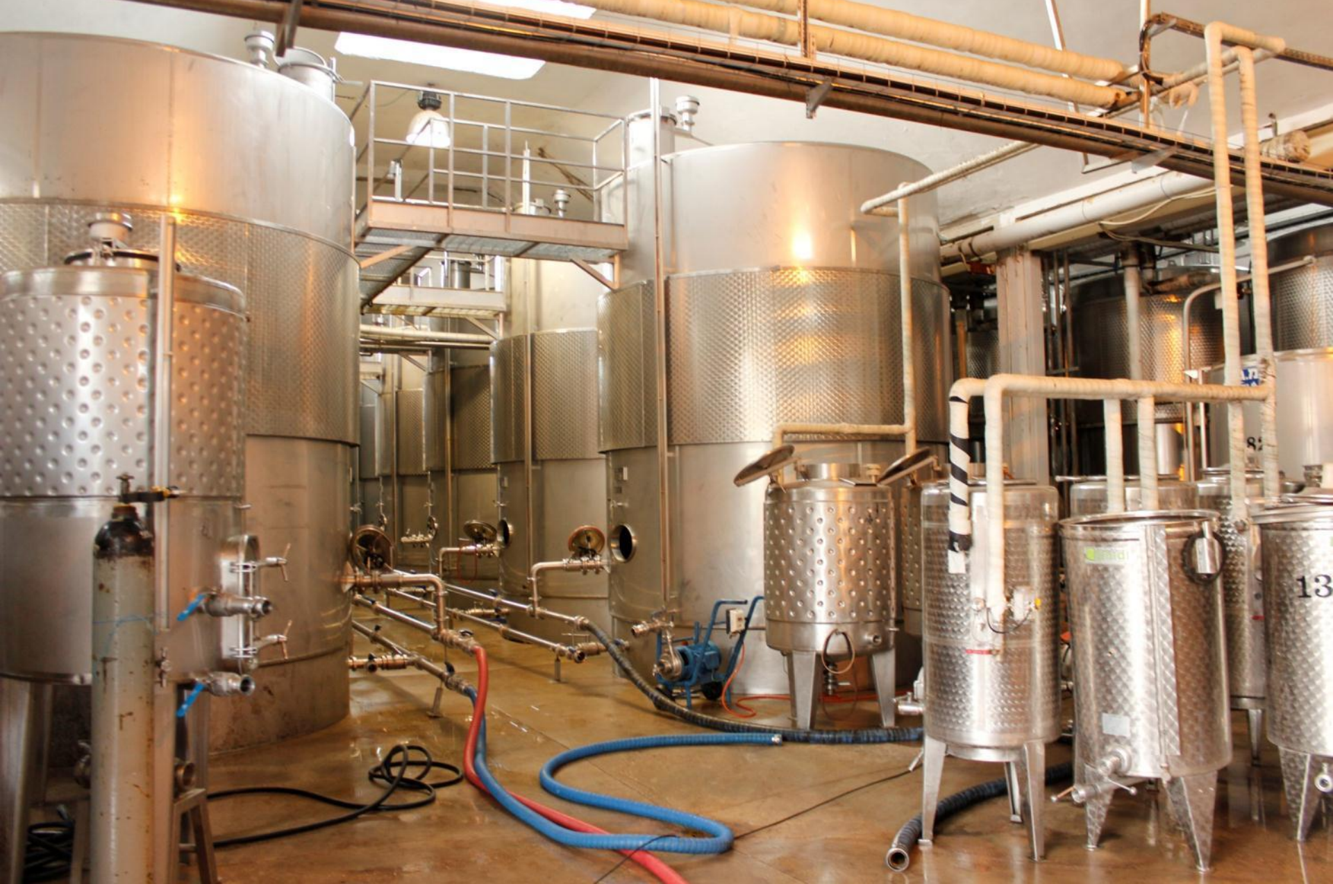
Бутик – участок приготовления самых высококачественных вин