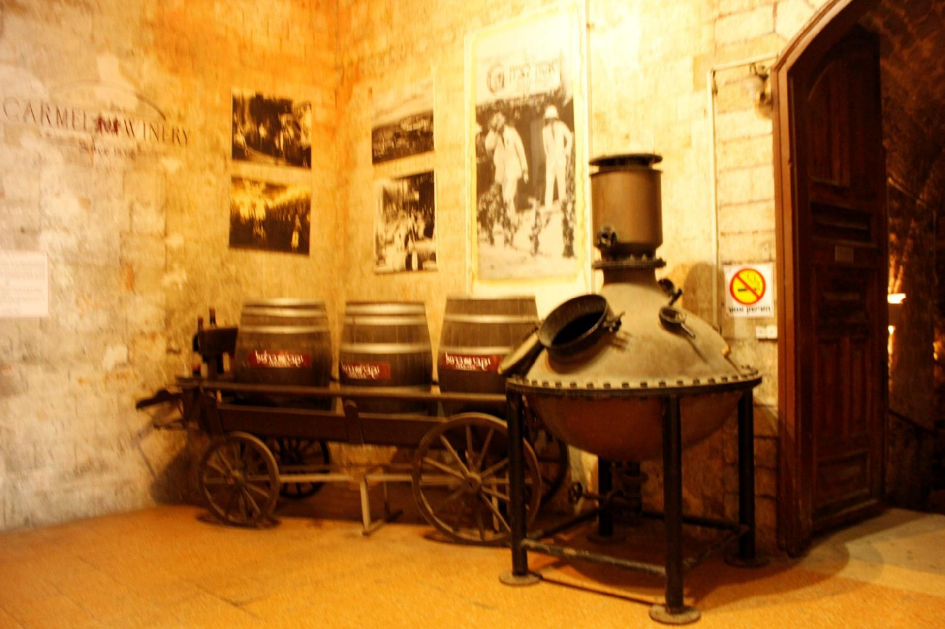
История винодельческого предприятия