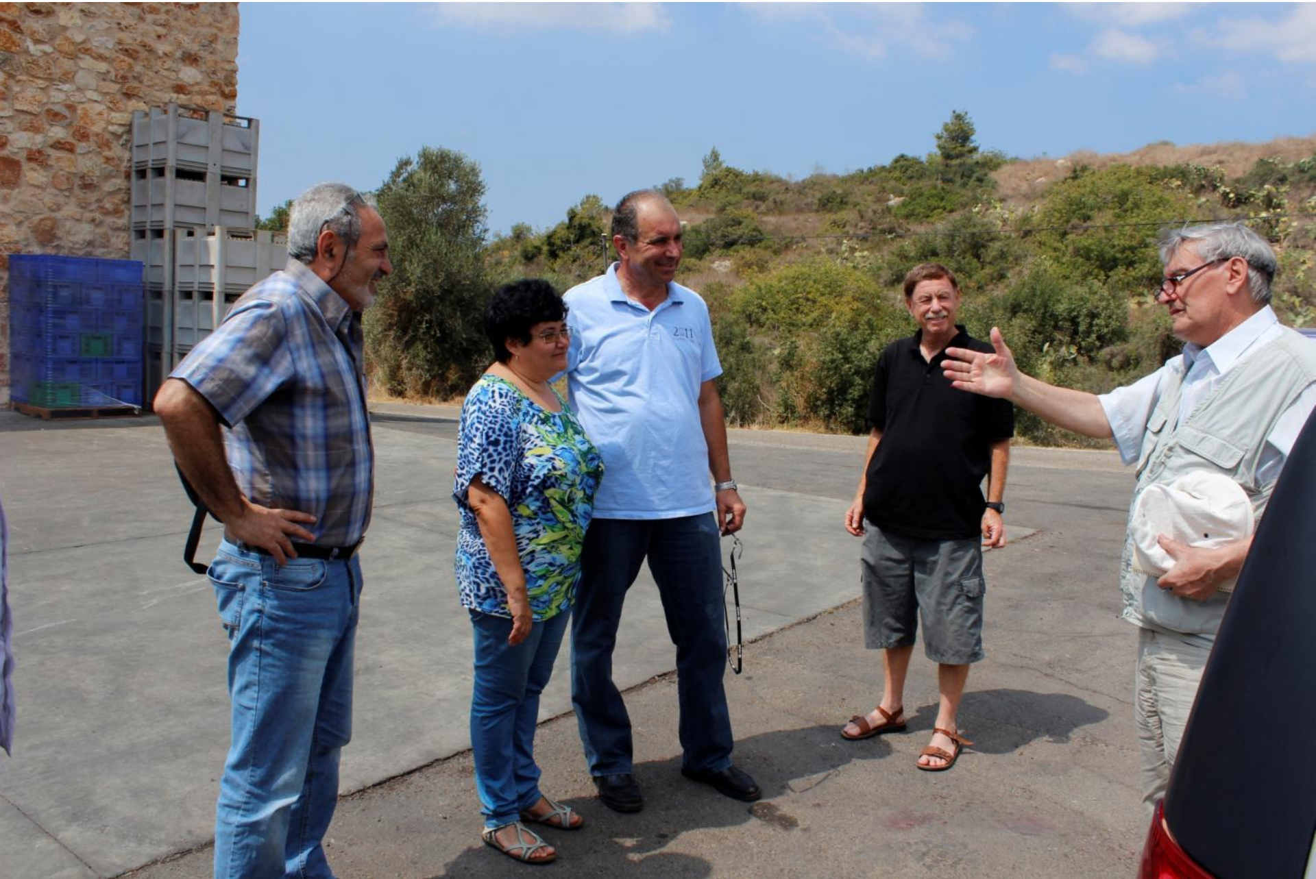
Знакомство с сотрудниками предприятия