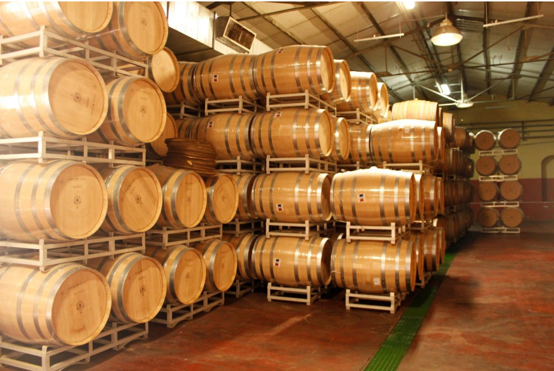
Бочковая выдержка вин серии «Премиум»