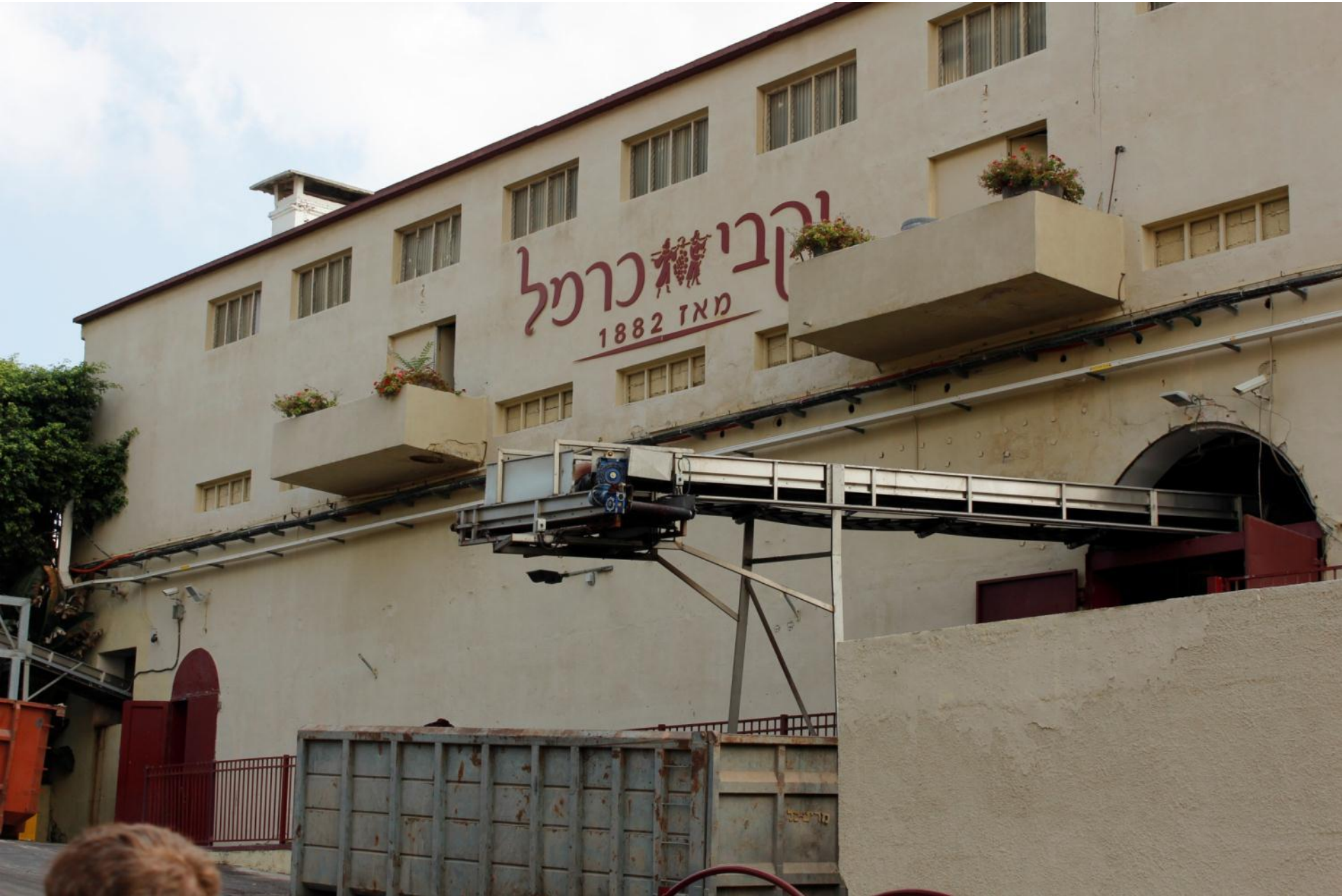
Винодельческое предприятие «Кармэль»