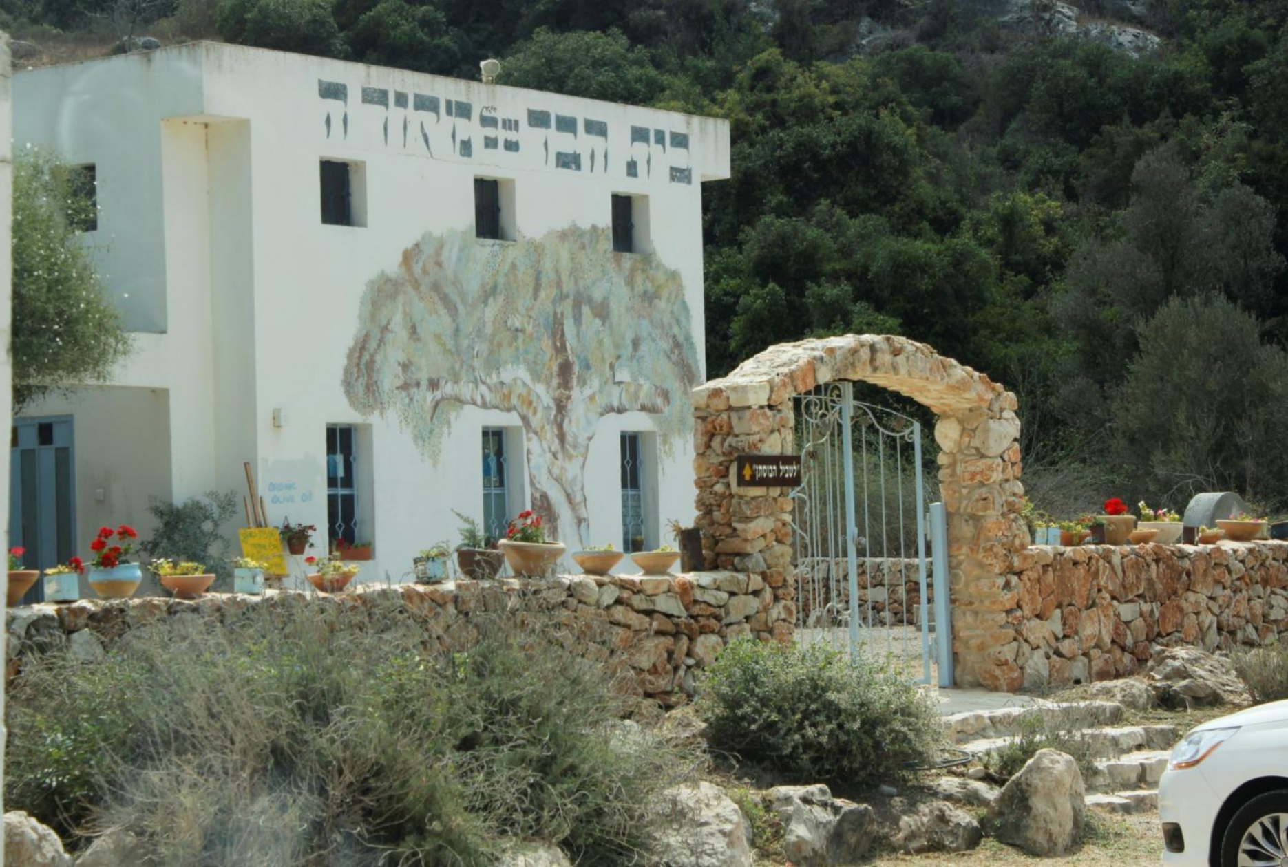
Винодельческое предприятие «Амфора»