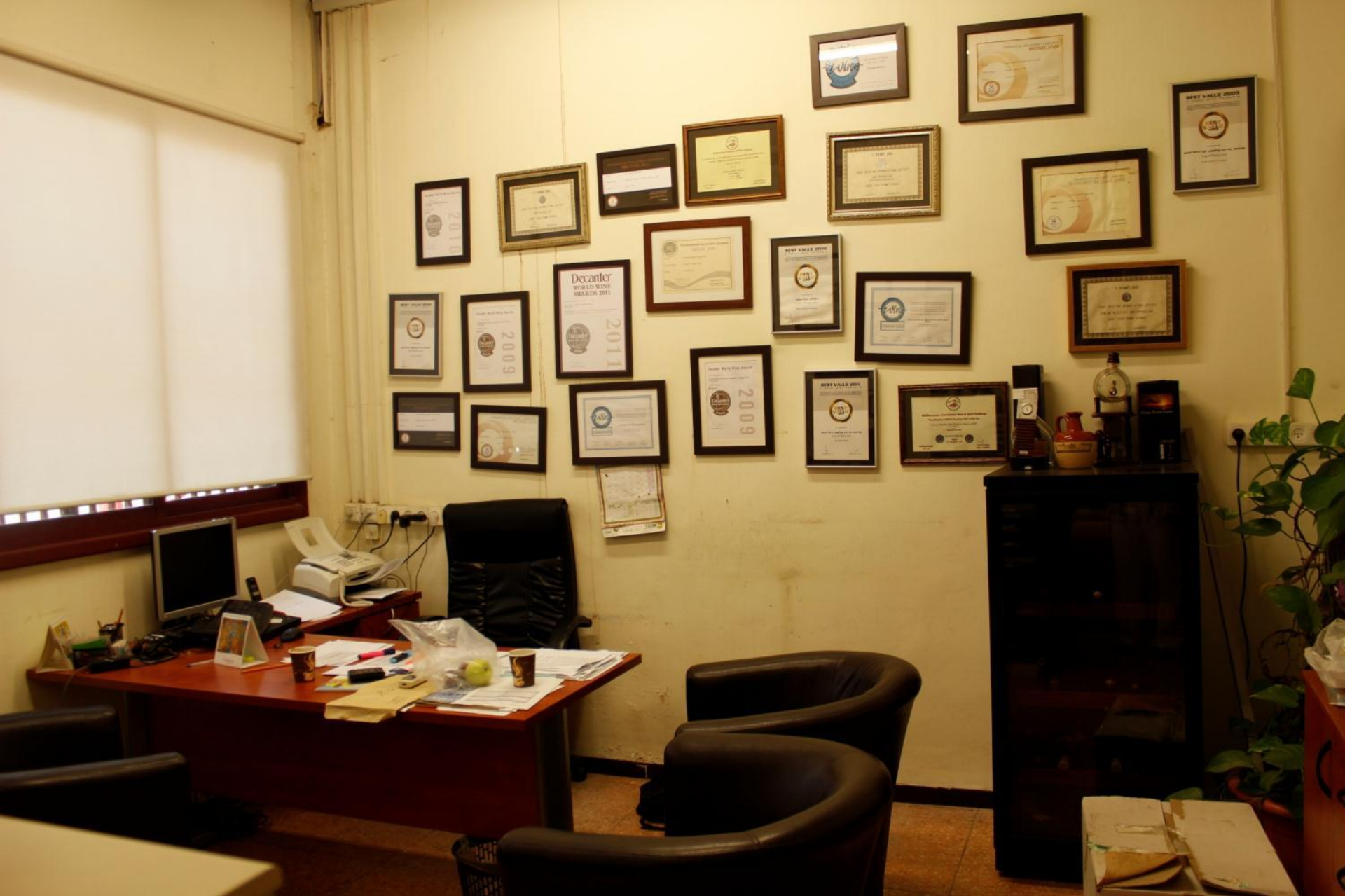
Кабинет начальника агроотдела