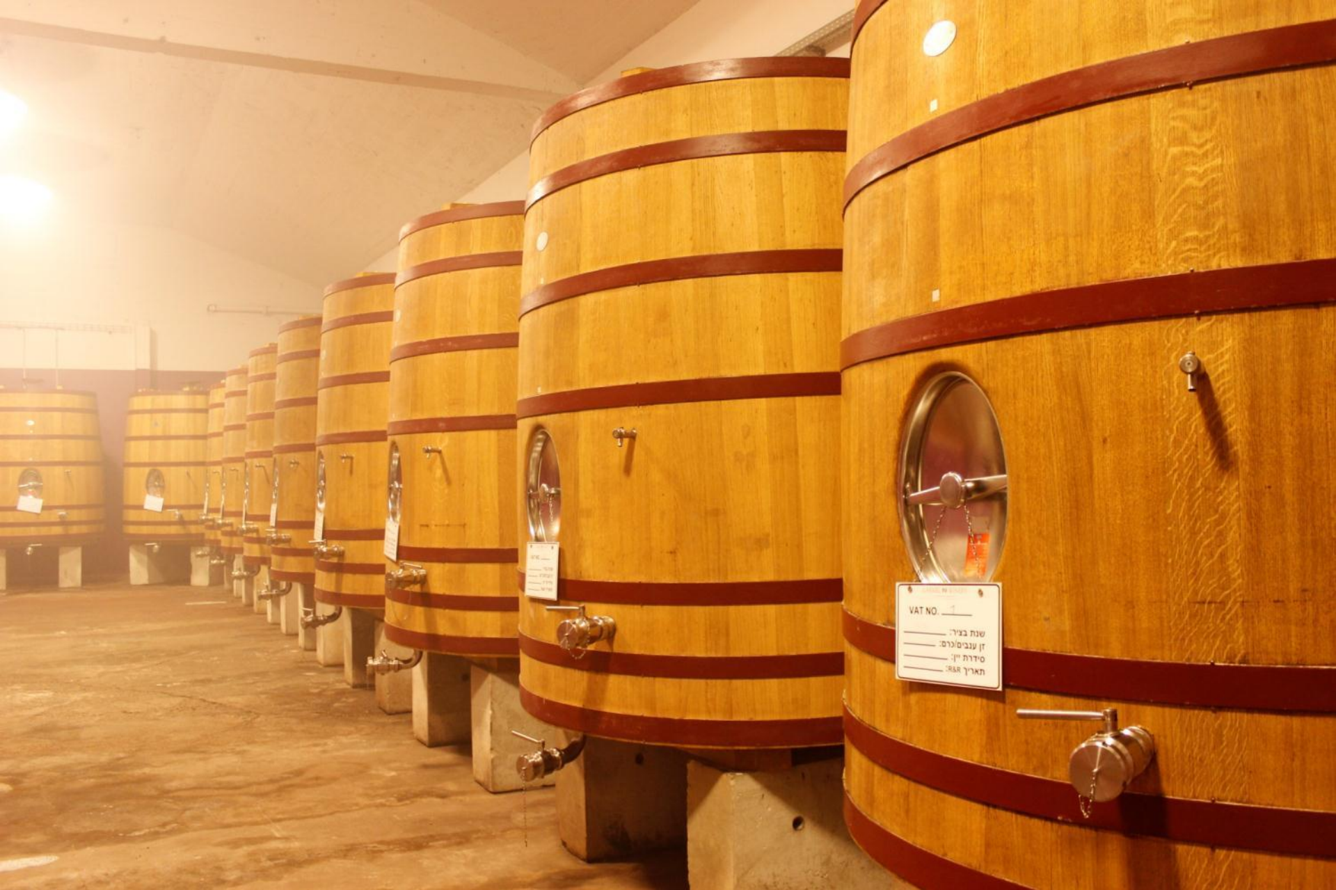
Чаны для выдержки вин высокого качества