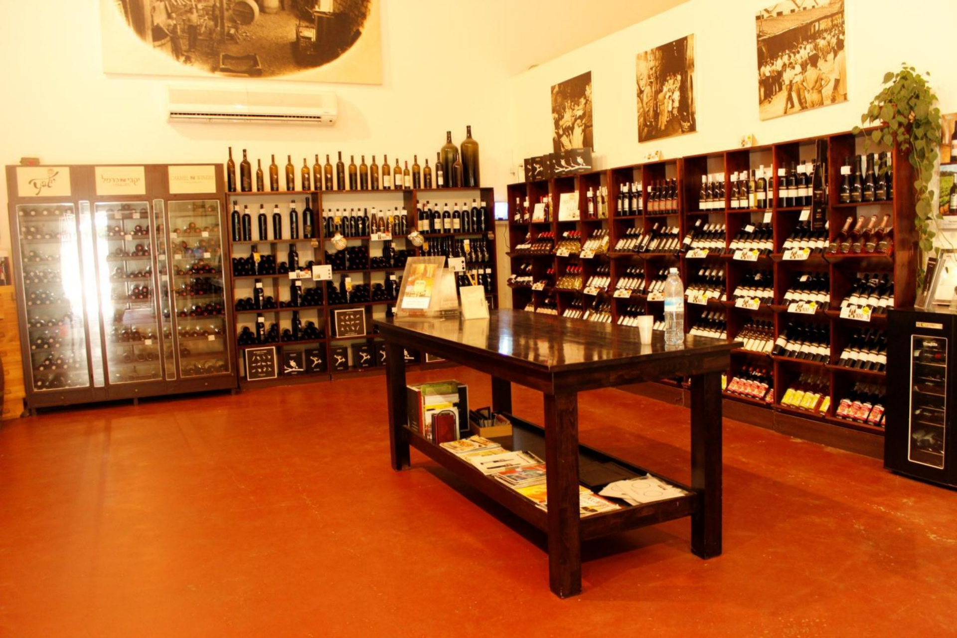
Центр культуры винопотребления