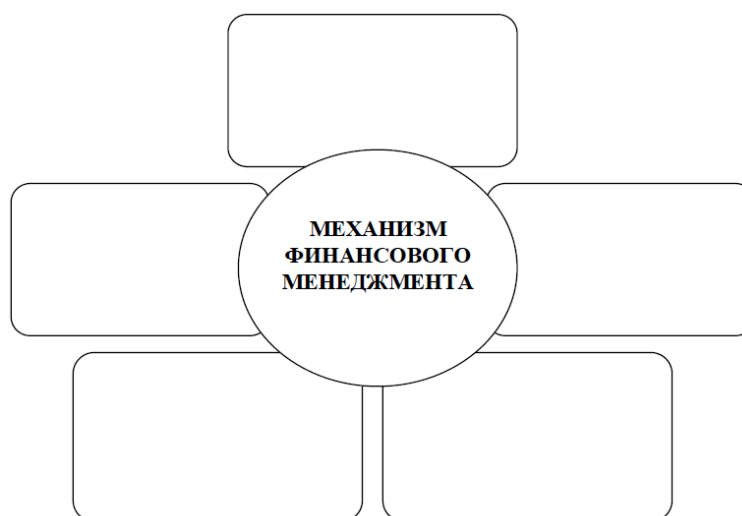
Рисунок – Состав основных элементов механизма финансового менеджмента

Задание 4. Укажите основные элементы механизма финансового менеджмента и заполните схему на рисунке.