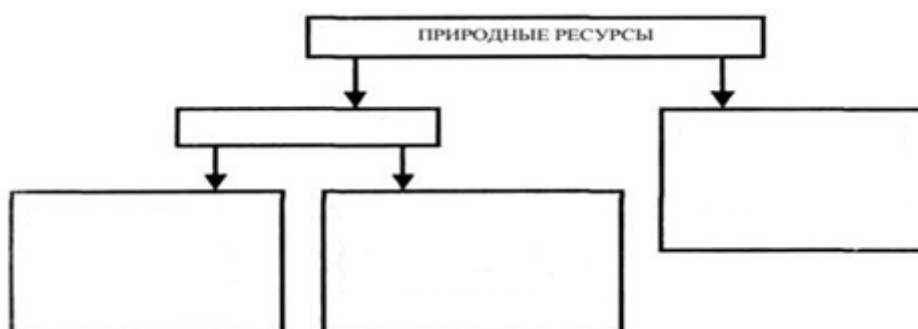
Рисунок 1 – Классификация природных ресурсов

Используя теоретические знания, полученные в лекционном курсе определить виды природных ресурсов. Результат заполнить на рисунке 1.