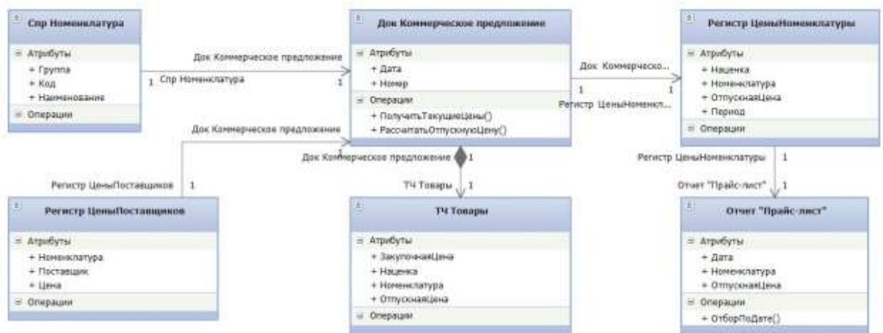
Рисунок 1 – Объектная модель конфигурации

Задача 4. Дана объектная модель (рисунок 1) и реализованная конфигурация (выгрузка в виде файла *.dt). Провести оценку полноты реализации программистом требований, приведенных в объектной модели.