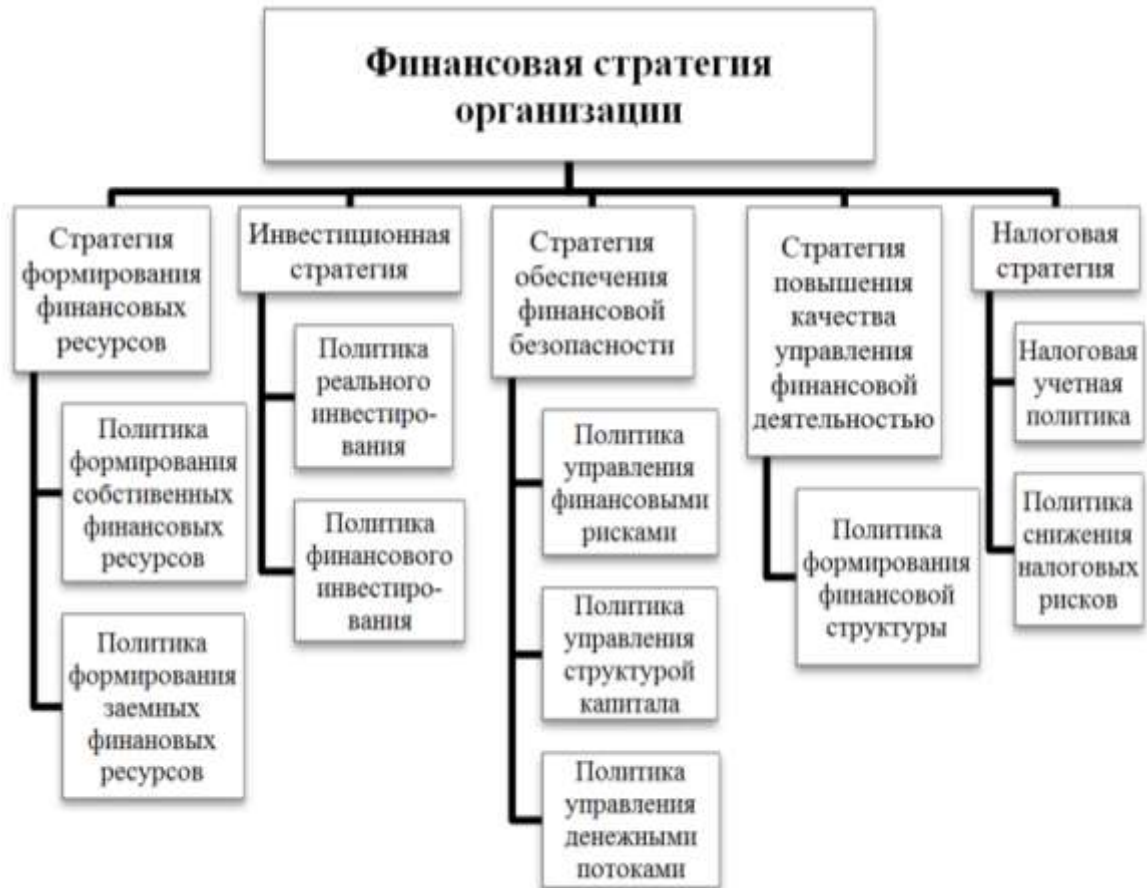
Рисунок – Компоненты финансовой стратегии организации

Задание 1. Опишите, чем, на Ваш взгляд, характеризуется каждый из компонентов финансовой стратегии организации (рисунок).