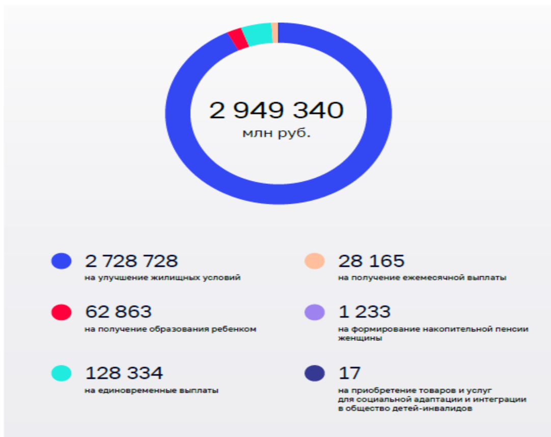
Рисунок 3 – Расходы по направлениям МСК за 2007-2020 гг., млн руб