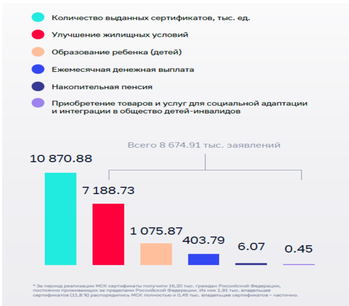
Рисунок 2 – Итоги реализации ФЗ № 256 за 2007-2020 гг.