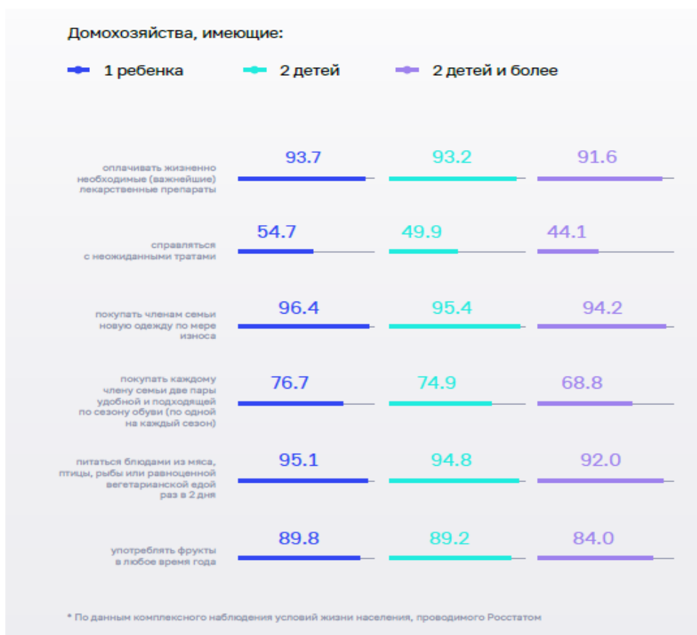
Рисунок 5 – Финансовые возможности домохозяйств с детьми в 2020 году