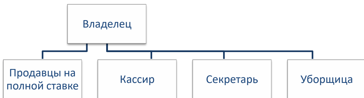
Структура оформившегося небольшого магазина

какова будет новая организационная структура: есть три основные варианта (и масса мелких разновидностей).