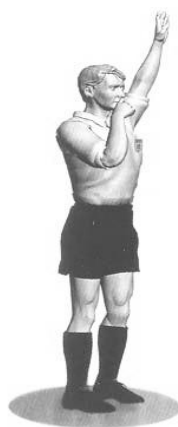
Рисунок 2 – Основные жесты судьи:

А – Желтая или красная карточка, В – Свободный удар