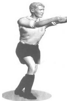
Рисунок 1 – Основные жесты судьи: