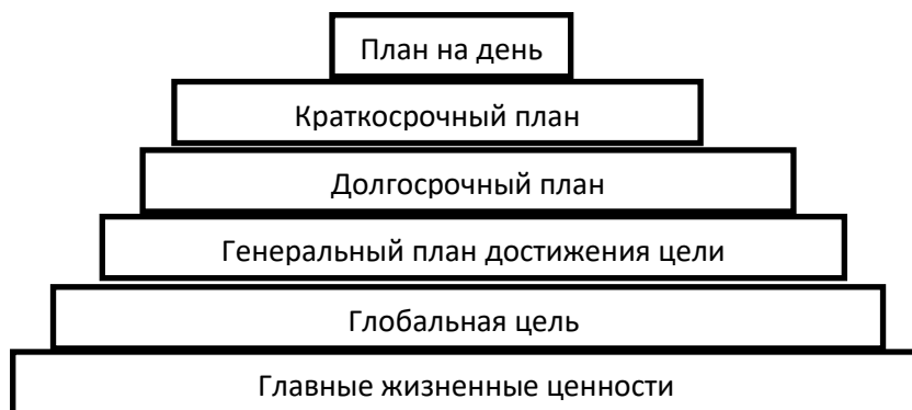
Рисунок – Система Б. Франклина

Система управления временем Бенджамина Франклина основана на базовых принципах классической системы управления временем, которые предусматривают, что любая глобальная задача, стоящая перед человеком, делится на подзадачи, а те в свою очередь – на еще более мелкие подзадачи. Визуально данный процесс можно представить в виде многоступенчатой пирамиды, а применение системы – как процесс поэтапного возведения этой пирамиды.