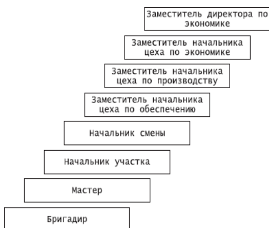
Рисунок 2. Карьера менеджера: вариант Б