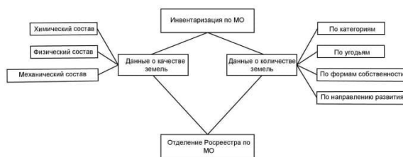
Рисунок 1 – Название рисунка (TNR, 14 кегль)