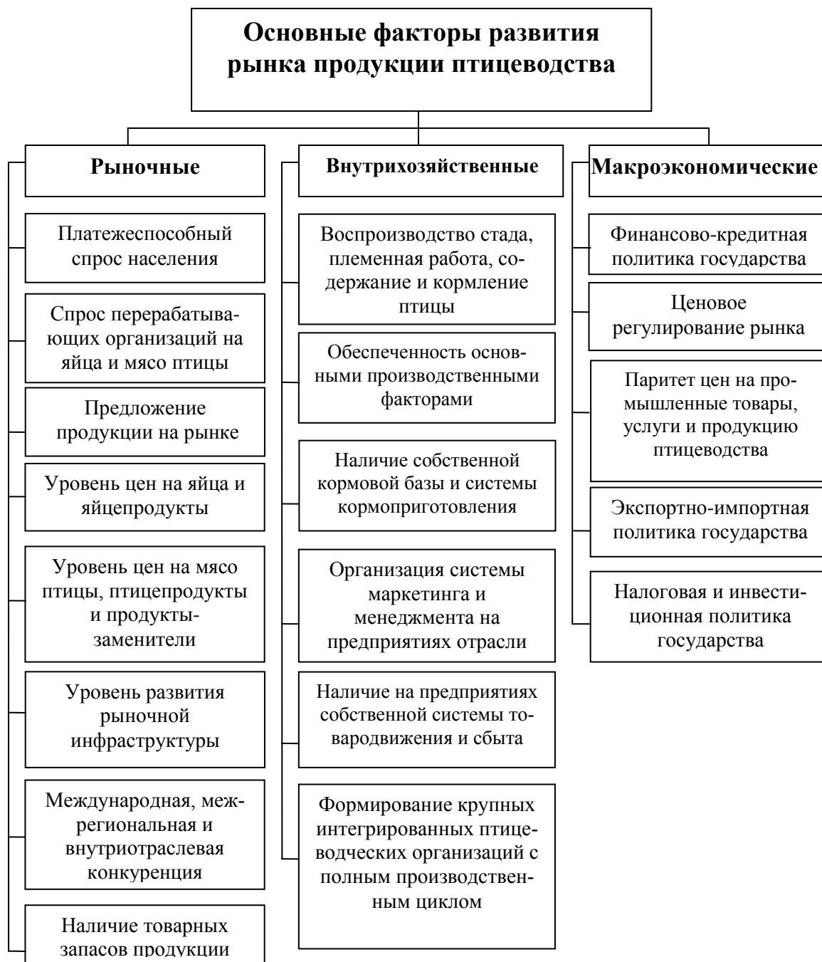
Рисунок 2 – Основные факторы развития рынка продукции птицеводства (составлено автором)

птицы и качества продукции ведет к росту рентабельности производства и реализации птицеводческой продукции (таблица 3);