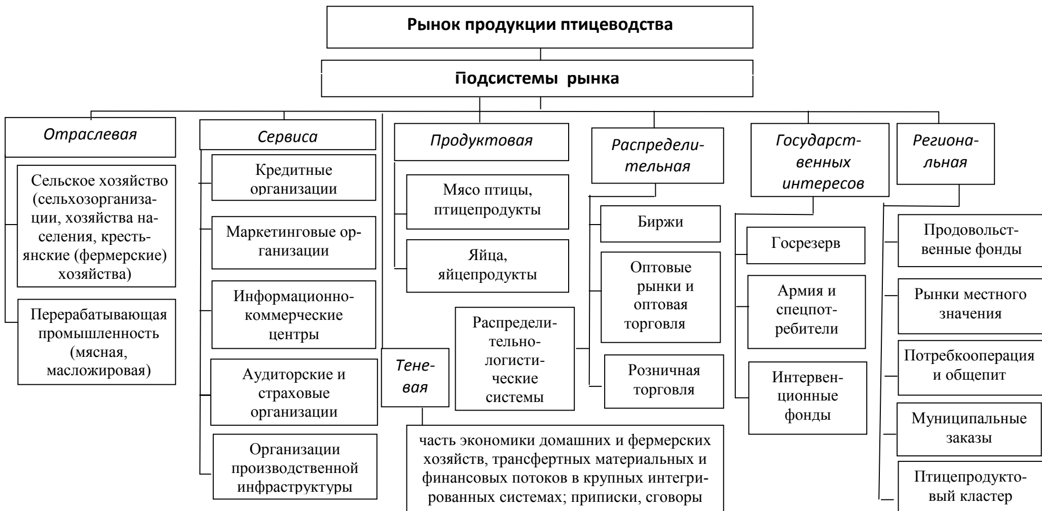
Рисунок 1 – Подсистемы рынка продукции птицеводства по организационно-функциональному признаку (составлено автором)