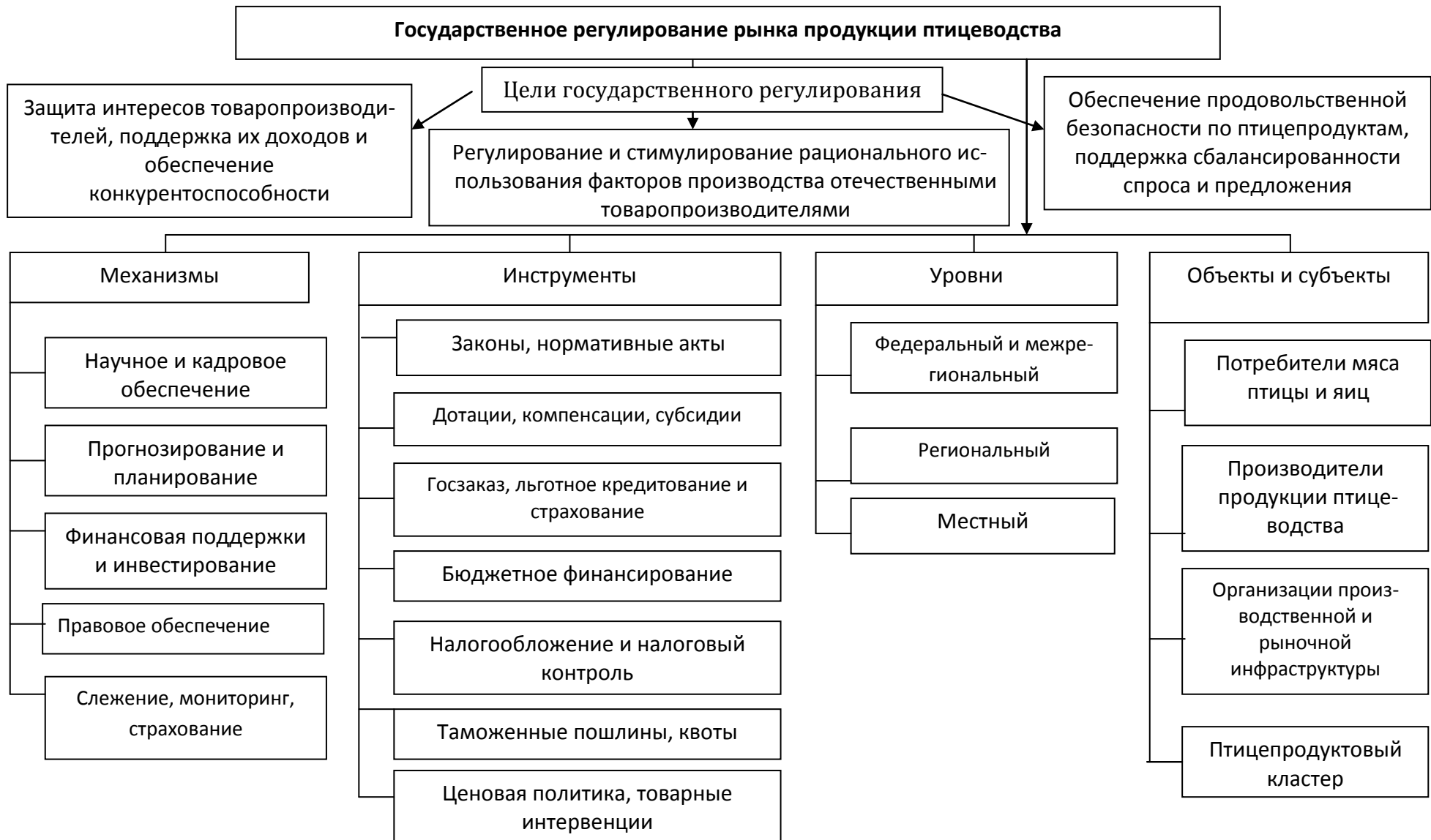
Рисунок 4 – Система государственного регулирования рынка продукции птицеводства