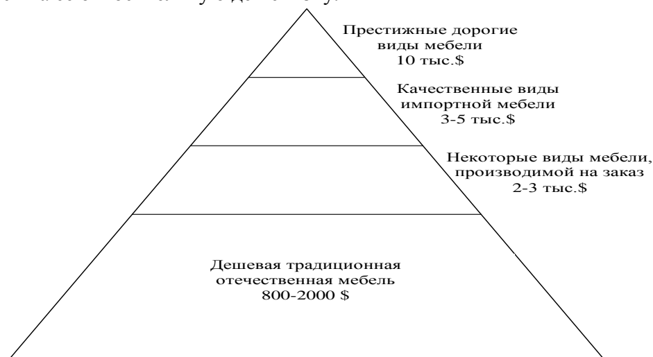
Рисунок 1 – Пирамидальное представление рынка мебели в России

– 2/3 покупателей мебели – приобретают мебель отечественного производства, ориентируясь на ее относительную дешевизну.